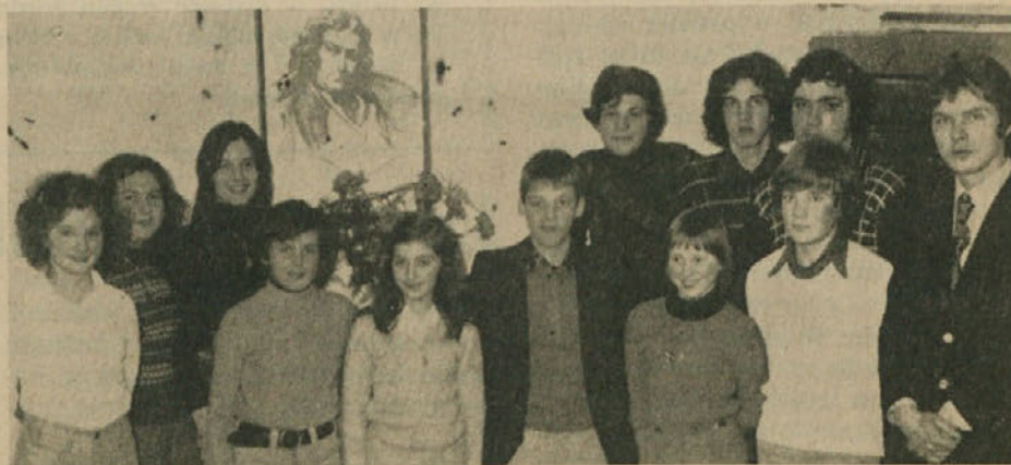
Ob letošnjem slovenskem kulturnem prazniku so bile številne prireditve tako na Tržaškem kot na Goriškem. Gornja slika je bila posneta po prireditvi PD Slovenec v Borštu.

Ljubitelje zborovske pesmi vabimo, naj se udeležijo prireditve, zlasti v tržaškem Kulturnem domu in v goriškem gledališču «Verdi», vsem pevkam in pevcem pa želimo, da bi dosegli mnogo, mnogo uspehov ter da bi še naprej s pesmijo izpričevali svoj narodni ponos.