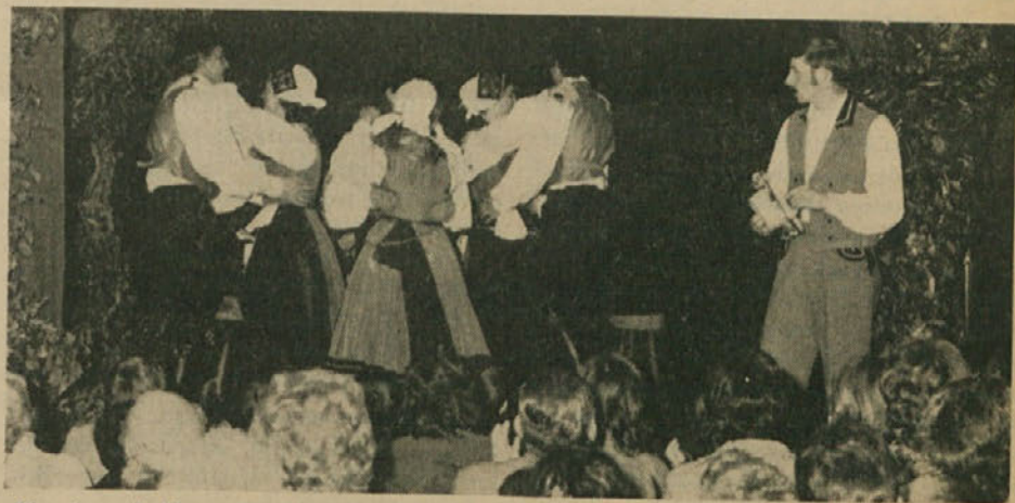
Skupina mladih prosvetarjev je v Lonjerju začela marljivo delovati. Organizirala je več prireditev. Gornja slika je bila posneta med letošnjo Prešernovo proslavo.