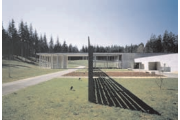
Slika 9: Poslovilni objekt - pogled s severa. The parting hall - view from the north.