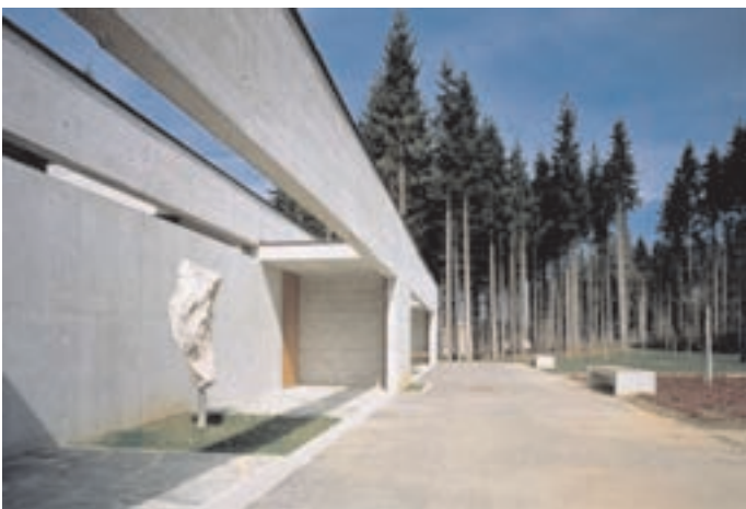
Slika 8: Prostor pred vežicami. The space between the parting chapels.