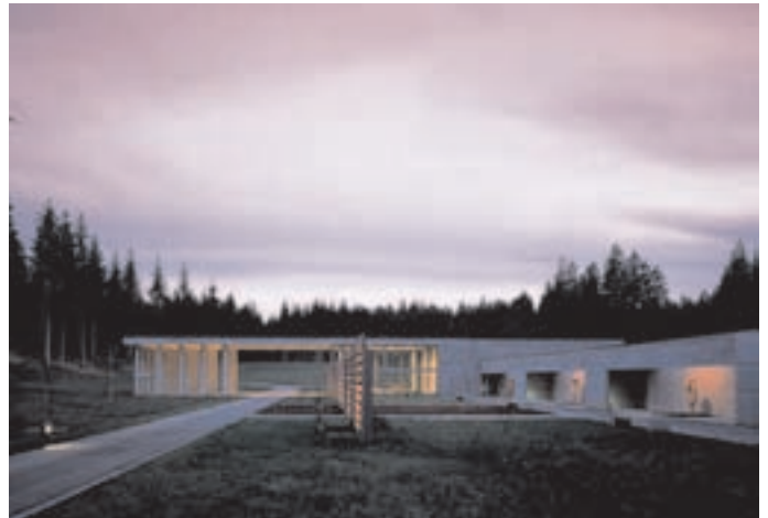
Slika 10: Poslovilni objekt - pogled s severa. The parting hall - view from the north.