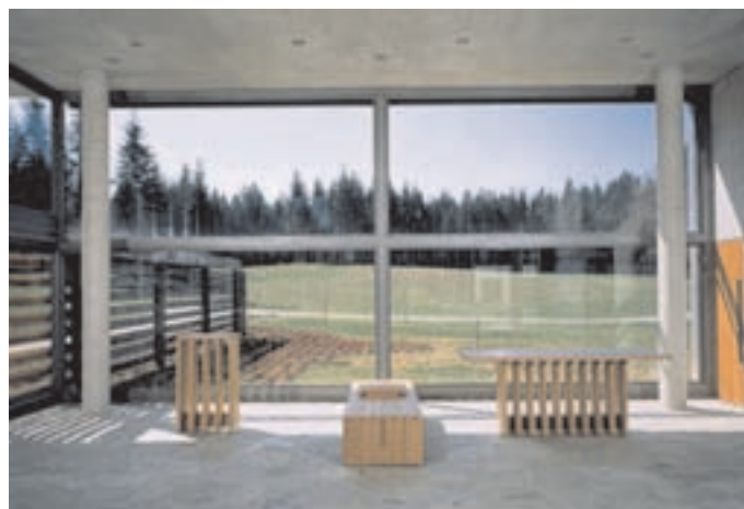
Slika 5: Poslovilna dvorana. The parting hall.