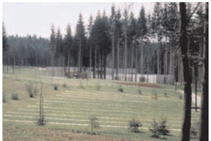
Slika 11: Grobna polja s poslovilnim objektom. Burial plots with the parting hall.