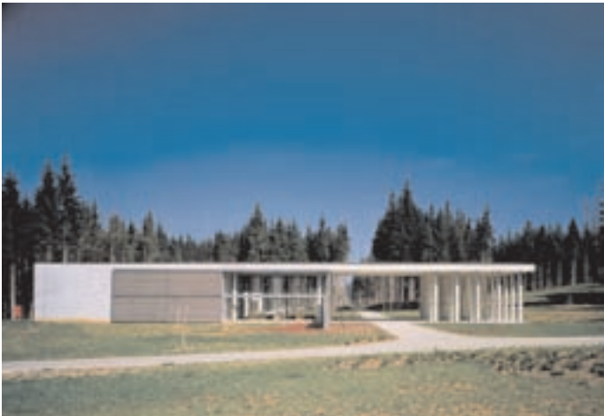
Slika 7: Pogled z juga. View from the south.