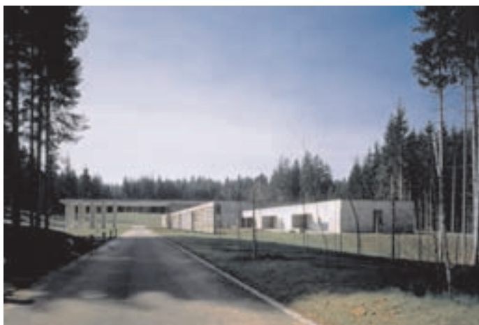
Slika 4: Glavna aleja. The main alley.