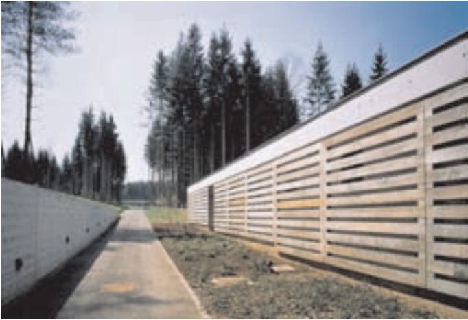
Slika 6: Pristop s servisnim objektom. Access with service buildings.