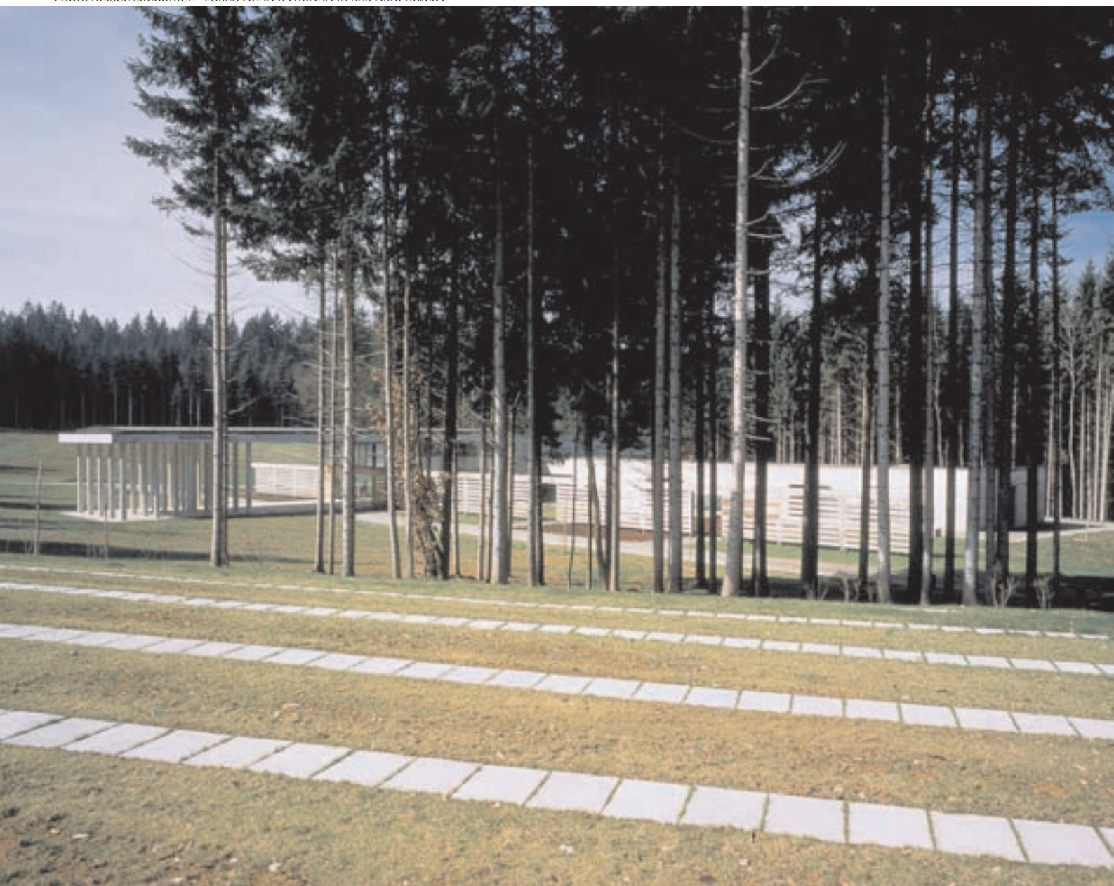
Slika 3: Jasa s poslovilno dvorano. The meadow with the parting hall.