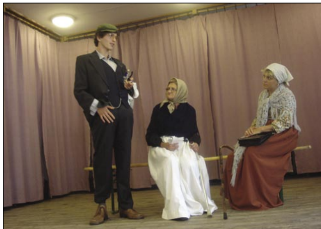
Tričlanska gledališka skupina iz Püconec je zašpilala dva skeča

Drüštvo porabski slovenski penzionistov - zdaj že tradicionalno - vsakšo gesen pripravi piknik za svoje člene. Letos so se porabski penzionisti in njihni padaške iz Püconec srečali 7. juliuša na Dolenjom Seniki, ka tü majo najbauptke pogoje za