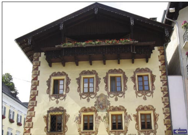
Pofarbana iža v St. Wolfgangu

višiča (nyaralóhely) po staroj monarhiji kak Opatija na Rovačkom ali Karlovy Vary na Češkom. Na otoki (sziget) srejdi jezera stogi grad pa je vse skoro takšo kak na Bleidi v Sloveniji. Na etom gradi dosta zdavanj držijo (se vej, ka samo bogati lidgé), pa so