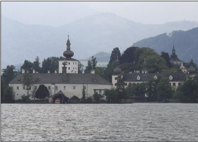
Gmunden z gradom na otoki

Laden dež je cüro v Somboteli, gda smo pred veukov bautov čakali na bus, šteri bi nas pelo na dolgo-dugo paut v tisti rosag, za šteroga dosti lidi brodi, ka se tam méd