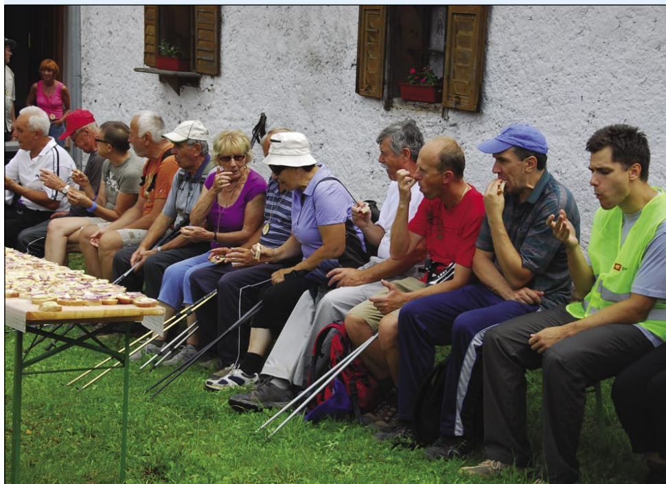
Postanek pri andovski domačiji, kjer so jih čakali s sendviči in pijačo

andovske domačije, kjer so jih s hrano in pijačo čakali člani Kulturno turističnega društva Andovci. Lahko so si ogledali tudi Mali Triglav in Hišo rokodelstva, ki je bila predana pred kratkim, zgrajena pa v okviru projekta Sosed k sosedu.