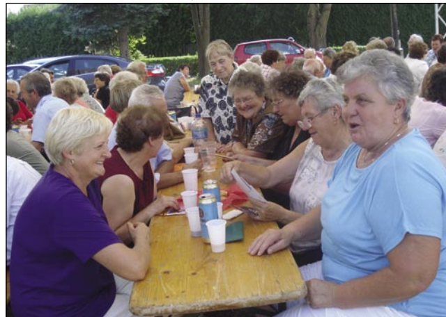
Tašoga ipa je čas za kakše kejpe pa pogučavanje tö

Gda so nazajprišli na dvor kulturnoga doma, tam je že trno veselo bilau. Restavracija Lipa se je skrbela za tau, naj bi lidgé nej lačni ostali, mlajše penzionistke so ojdle od pulta do stolov kak (s)piš pa nosile drugim küjane klobase s krumpičovo šalato. Za