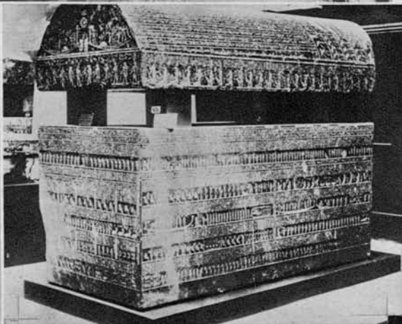
Prekrasni sarkofag nekega faraona v kairskem muzeju.

Na desni: Dragoceni kip mladega Tut-Ank-Amena.