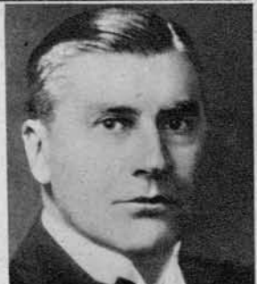
Na desni: Baron Yrjö-Koskinen, finski zunanji minister, ki je pred kratkim podpisal z Rusijo pogodbo o nenapadanju. Enako pogodbo sklepa Rusija s Poljsko, dočim visi z Romunijo še v zraku zaradi vprašanja Besarabije, ki bi jo Romuni radi obdržali trajno zase.