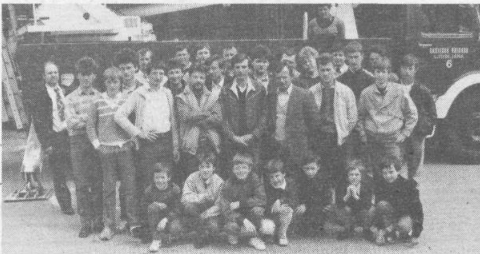
Ob zaključku tečaja za nižje gasilske častnike se prikaz sodobne opreme in orodja gasilske brigade v Ljubljani - 26. aprila 1987.

V svoj delovni program sta si obe zvezi zadali nujno usposobitev operativnega kadra. Tečaja se je udeležilo in ga tudi uspešno zaključilo 27 tečajnikov. 13 jih je opravilo tečaj z odličnim uspehom, 10 s prav dobrim in 4 z dobrim.