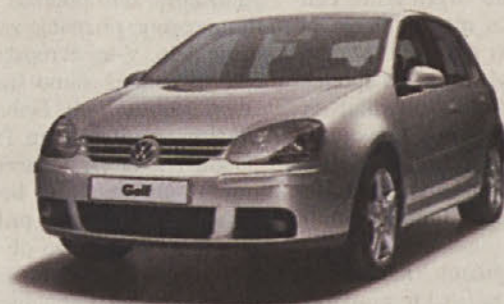
Golf 1.6 s 102 KM / (75 kW) je sedaj cenejši za 390.000 SIT.