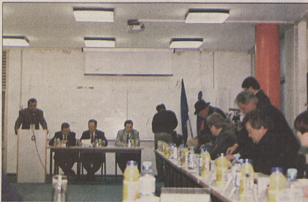
Svetniki SDS so vstali in protestno zapustili izredno sejo občinskega sveta.