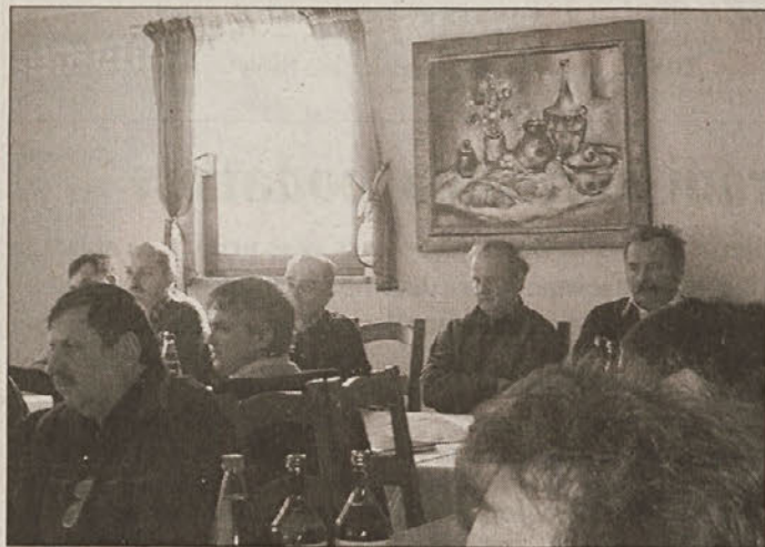
Zadržniki na izobraževanju

kov in živil, prihodnje sodelovanje zadrug v zadržnem bančnem in finančnem sistemu, predstavitev dela v regiji in aktualna dogajanja v kmetijstvu.