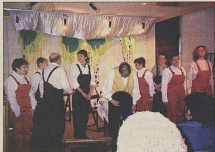
Nastop brežiških "Žarkov" v Beli Krajini