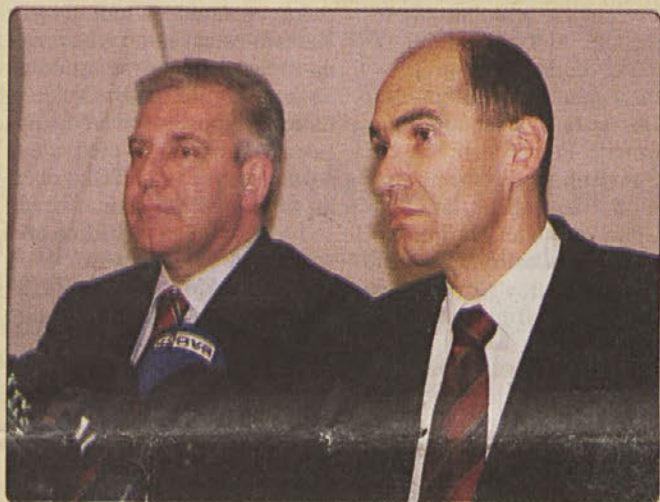
Ivo Sanader in Janez Janša

Ivo Sanader se je zahvalil Sloveniji za podporo pri približevanju Hrvaške v Evropsko unijo, Janša pa je dejal, da bo Slovenija tudi v prihodnje aktivno podpirala Hrvaško pri njenem vključevanju v zvezo NATO.