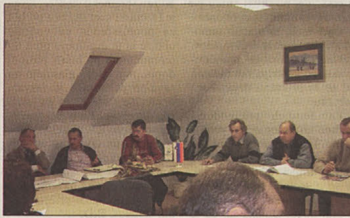
Kapelci razpravljajo o novi podobi svojega kraja.