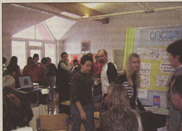
Mladi parlamentarci na Blanci