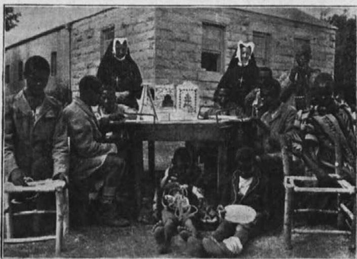
Gospodinjstva šola pod nadzorstvom misijonskih sester.

vega, kar bi moglo zanesti srečo in zadovoljnost v družinsko življenje. Dal Bog, da bi kmalu postalo življenje afriške žene bolj človeka vredno na srečo družin in zlasti otrok!