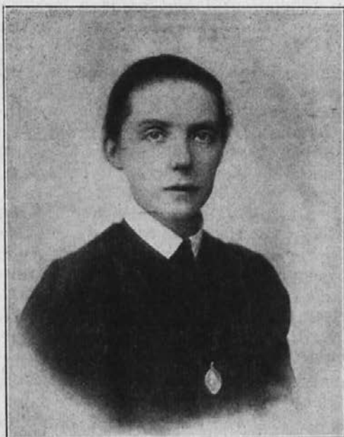
Marija Terezija Ledóchowska.