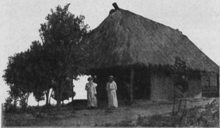
Revna zasilna cerkvice.

Ko mi je naročil naš preč. apostolski vikar, naj zidam, mi je izročil le tisoč angleških šilingov. S tem denarjem sem kupil pločevino za streho kapele in poslopja, ki bo služilo misijonarju v stanovanje. Za pločevino in še za 4 sodčke cementa, 4 vreče apna in zabojček žebeljev sem dal ves ta denar in še dosti ni bilo. Kako naj napravim vrata in okna? To sem povedal kristjanom v Potwe, in ti so takoj prišli na delo, čeprav vlada lakota in