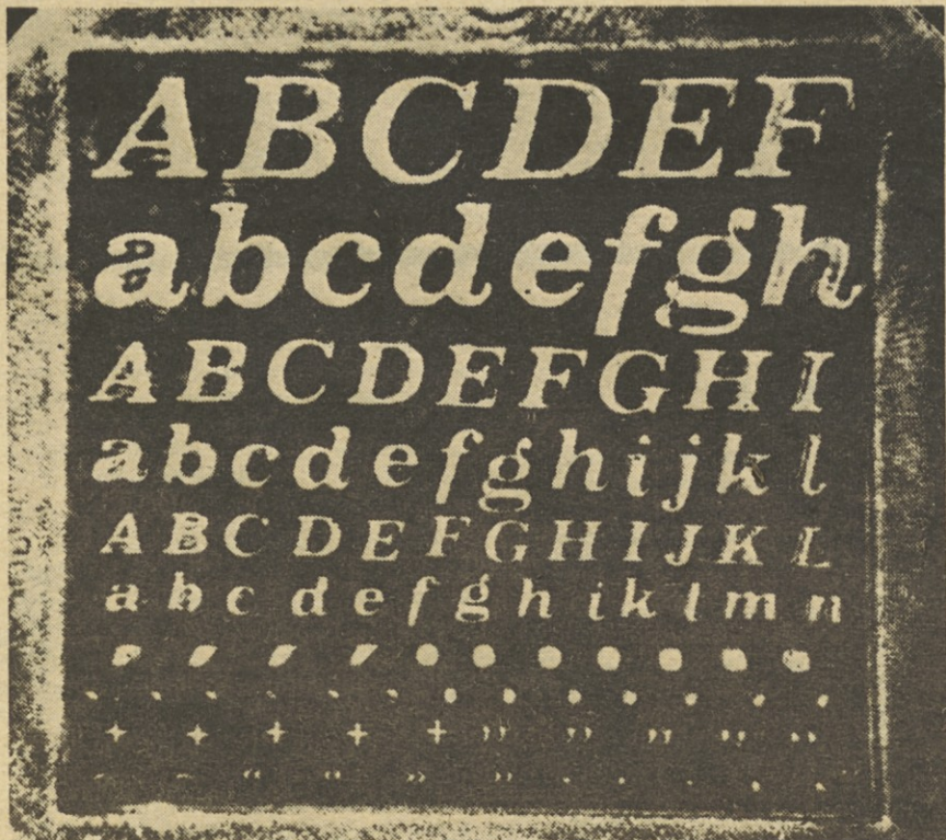
Projekcija slike iz holograma, ki je bil zapisan v kristal KCl. Uporabili so kristal s prostornino cca 2,5 kubičnih centimetrov.

Politični aktiv ZP Iskra bo v ponedeljek 17/12-1973 pretresel pomen in potek sprejemanja samoupravnega dogovora ZP Iskra ter se dogovoril o skupni akciji vseh družbenopolitičnih organizacij pri razpravah in njegovem sprejemanju po temeljnih organizacijah združenega dela ZP. Tudi Poslovni odbor ZP, ki bo zasedal v torek 19. 12. 1973, bo imel v eni izmed točk dnevnega reda — sprejemanje tega pomembnega dokumenta v TOZD Iskre. Priprave tečejo v vseh smereh, pri čemer se bodo še posebej angažirale posamezne strokovne službe naših organizacij, zlasti pa še sekretarji in pravniki, o čemer so se pogovorili na svojem rednem delovnem sestanku v petek 14. 12. 1973. I. S.