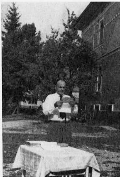
Ob otvoritvi čebelarškega doma

Na rednem občnem zboru v letu 1964 sem predlagal, da bi si križevski čebelarji postavili svoj dom. Mnogi tovariši so takrat dvomili, če bomo sposobni zgraditi čebelarški dom.