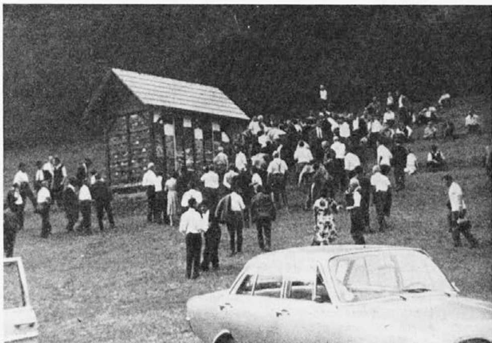
Gostje iz tujine pri plemenilni postaji tov. Bukovška na Golem Brdu.