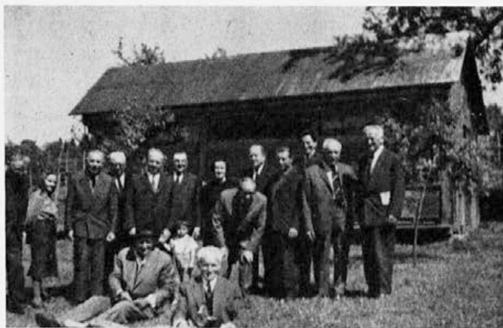
Mariborski čebelarji na obisku pri svojih tovariših v Poljčanah.