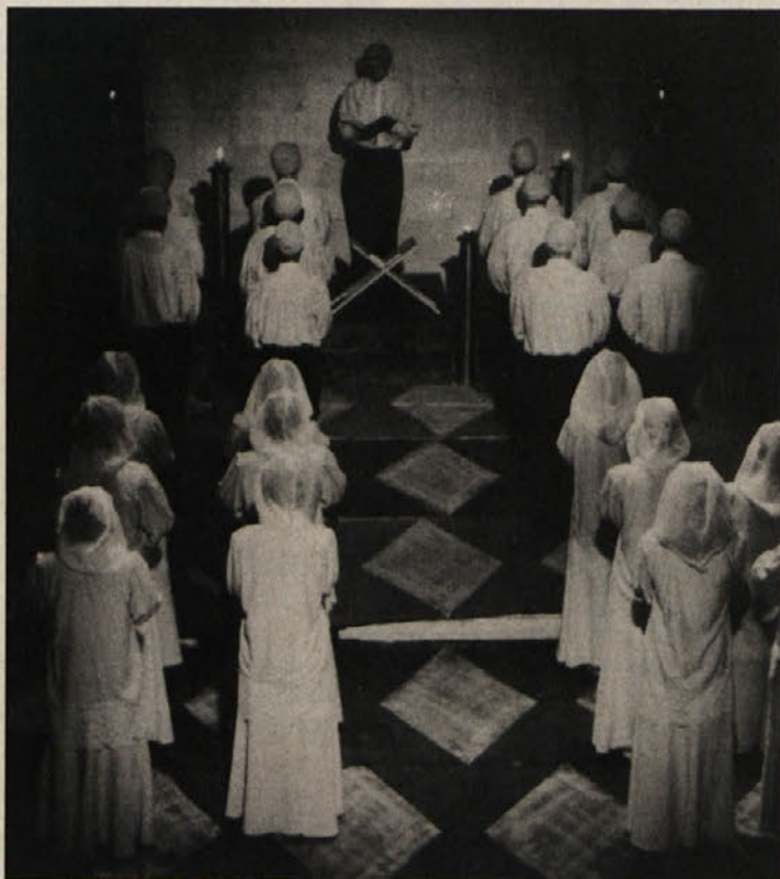
Iz spleta mohamedanskih pesmi.