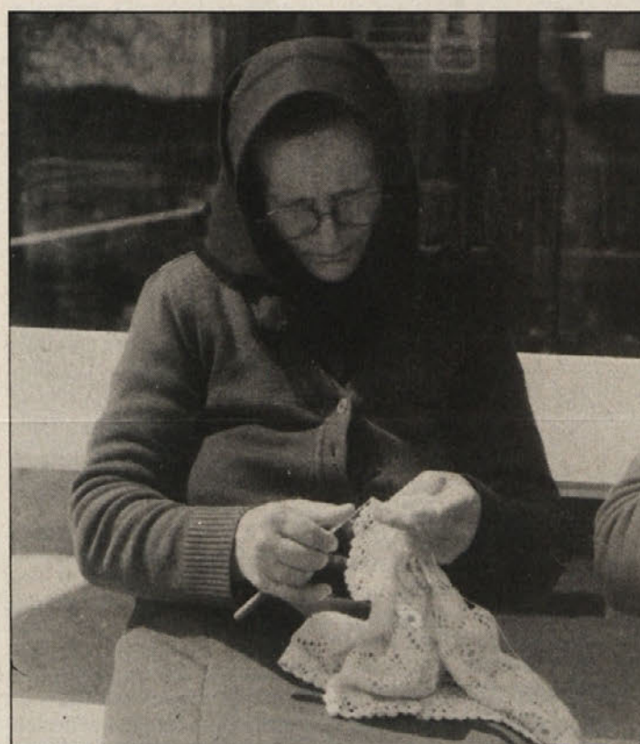
Vojna je prizadela vse narode v Bosni in Hercegovini: med begunci v Postojni smo srečali tako Muslimane in Hrvate kot tudi pripadnike srbske narodnosti.

Pristojni predstavniki Slovenije za begunjska vprašanja so zaradi nezadostne pripravljenosti mednarodne skupnosti za pomoč beguncem predlagali takojšen sklic evropske konference o beguncih na ozemlju bivše Jugoslavije, ki naj bi bila v Ljubljani. Isti predlog je že posredoval predsednik predsedstva republike Slovenije Milan Kučan konferenci o Jugoslaviji, ki je bila pretekli teden v Bruslju.