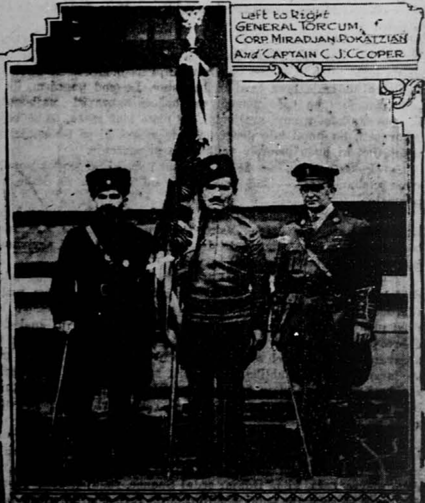
AMERIŠKA GENERALA V ZDRUŽENIH DRŽAVAH.