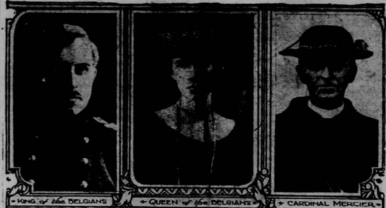
Belgijski kralj, kraljica in kardinal Mercier, ki bodo prišli v Ameriko.