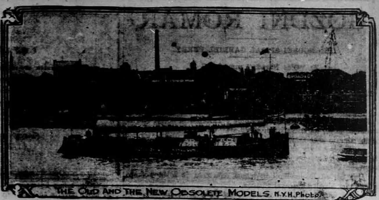
ANGLEŠKI MORNARIŠKI TOPOVI.

FINSKA: — Glede prohibicije je glasovala cela dežela potom finskega parlamenta s tozadevni sklep, je vetiral car v maju 1917, nakar je finski narod pregledal svojo neodvisnost od Rusije ter žal