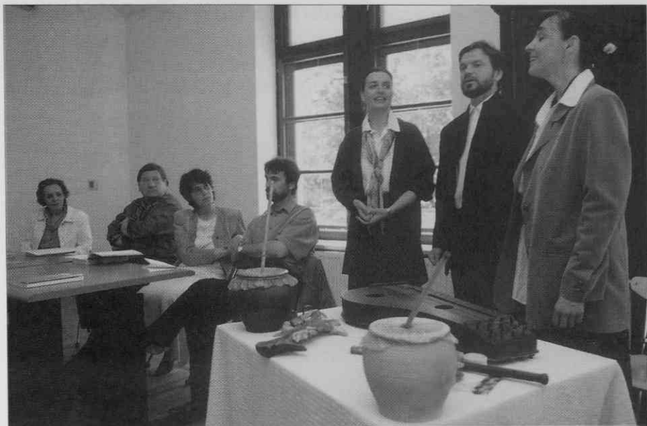
Preizkus akustike v novih prostorih - Trutamora Slovenica (foto: I. Omahen, maj 1997).