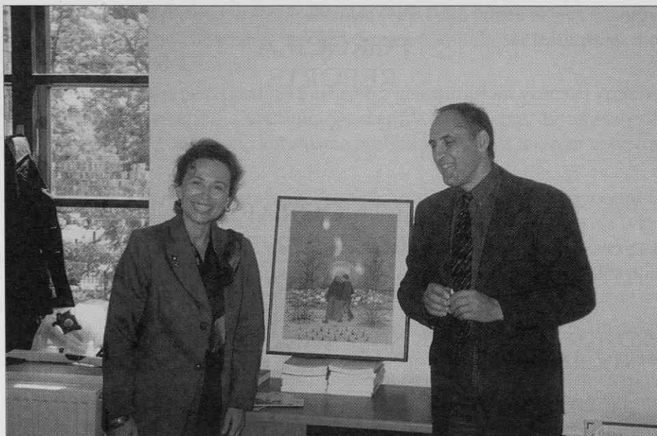
Darilo zagrebških kolegov ob selitvi v nove prostore (foto: I. Keršič, maj 1997).

upravni, informacijski, raziskovalni, avdiovizualni, založniški, konservatorsko-restavratorski in drugim dejavnostim (z javno čitalnico, predavalnico in manjšim razstaviščem). Izvajalec prenove, Gradbeno podjetje Grosuplje, je 13. februarja uspešno prestal tehnični pregled, 26. marca pa je bilo za stavbo pridobljeno uporabno dovoljenje.