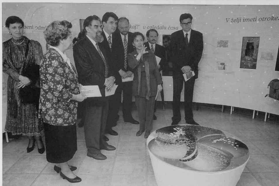
Vrata kroga (foto: I. Omahen, junij 1997).