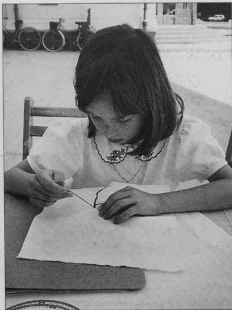
Naučila se bom vesti (foto: S. Kogej Rus, junij 1997).