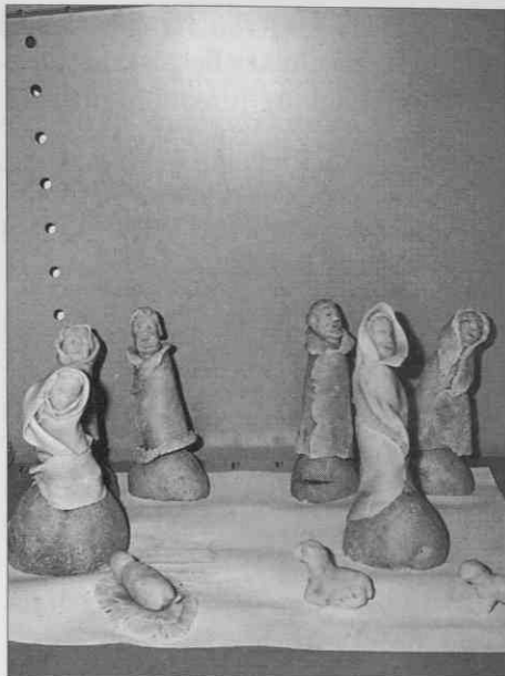
Figurice se morajo pred peko posušiti na zraku.