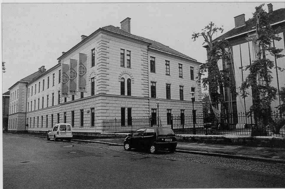
Novo domovanje Slovenskega etnografskega muzeja (foto: I. Omahen, junij 1997).

V prvih dneh junija je Slovenski etnografski muzej odprl vrata svojim obiskovalcem na novem naslovu, na Metelkovi 2. Preselil se je v prvo obnovljeno hišo na jugu stavbnega sestava nekdanje vojašnice, ki je bila zgrajena med leti 1886 in 1889 v nekdanjem ljubljanskem šempetrskem predmestju. Leta 1994 je bil ta južni del kompleksa s sklepom Vlade Republike Slovenije dodeljen Ministrstvu za kulturo. Slovenski etnografski muzej je spomladi leta 1995 dobil v njem v rabo dve stavbi. Najprej je bila omogočena notranja prenova manjšega, manj zahtevnega objekta; pogojno imenovanega upravna hiša, namenjenega