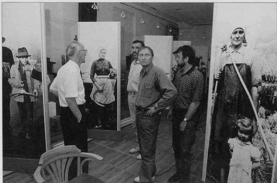
Nastajanje razstave Okna zbirke (foto: I. Omahen, junij 1997).

Pod poljudnimi naslovi so v besedi nanizane vse zbirke Slovenskega etnografskega muzeja. Predstavljene so z izbranimi eksponati in s strnjnim vedenjem o posameznih predmetih ali o razstavljenih skupinah reči. Razstava je poizkus opredmetenja tolikokrat ponovljenih besed o vsem, kar muzej hrani; o predmetnih pričah "gospodarjenja, dela, bivanja, oblačenja, trgovanja, družbovanja, ljubljenja, verovanja in umetniškega ustvarjanja..."