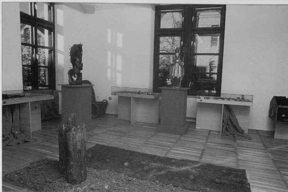
Jesen na razstavi V zaveztju svetnikov.