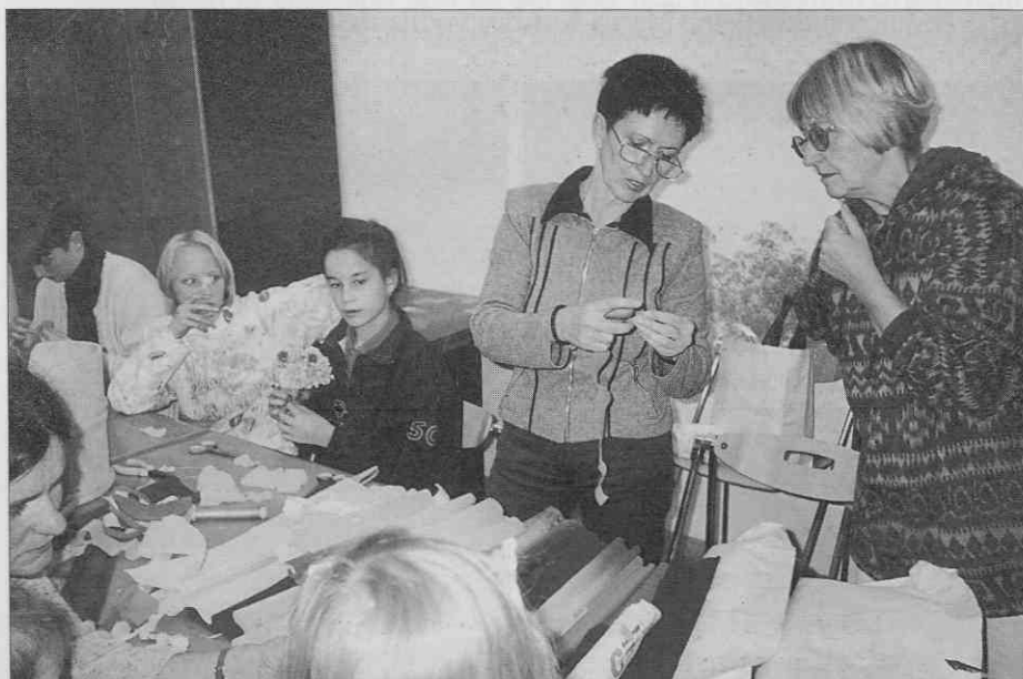
Izdelovanje cvetja iz papirja je pritegnilo tako mlade kot stare.