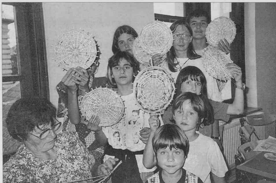
Ponosni udeleženci pletarske delavnice (foto: S. Kogej Rus, september 1997).