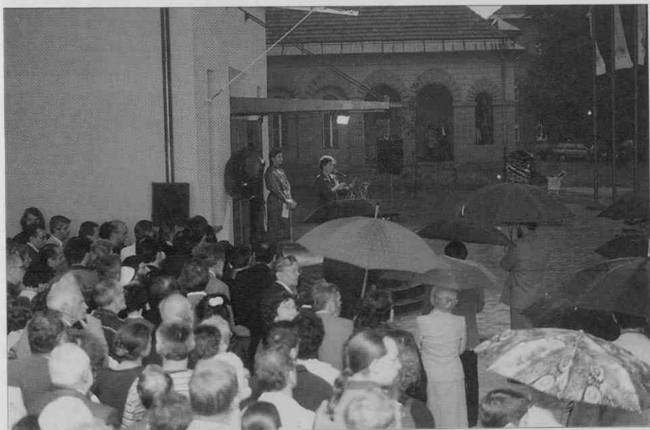
Vodni krst ni bil v programu odprtja (foto: I. Omahen, maj 1997).