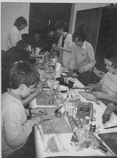
Delavnica izdelovanja jaslac iz testa (foto: I. Keršič, december 1997).

iz testa. V predbožičnem času so bili izdelki udeležencev razstavljeni na hodniku Slovenskega etnografskega muzeja.