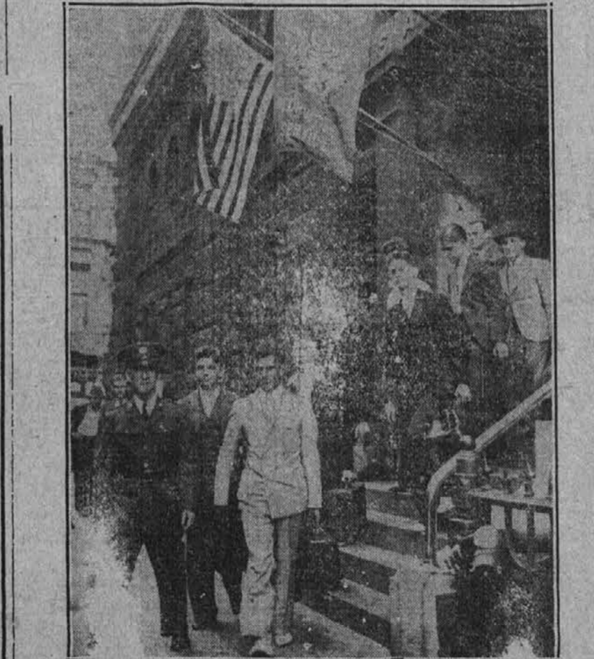
Kongresni načrt za povečanje armade iz 118.000 na 165.000 mož, ki je bil pred kratkom odobren, se je pričel izvajati širom cele države. Razni naborni uradi so se otvorili po vseh večjih mestih. Slika nam kaže, ko novinci, ki so se vpisali v vojaško službo, zapuščajo naborne urade na poti v taborišče.