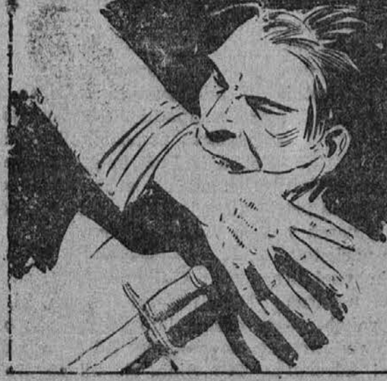
Napisal: Edgar Rice Burroughs

Roka z bodalom je bila že čisto blizu Tarzanovega obraza in sedaj se je zgodilo nekaj nepričakovane. Pogled mu je postal divji kot divje zveri, premaknil se je s svojim telesom in njegov ostri zob je so započeli kot-jeklo Dorskemu v roko, da je ta z groznim krikom spustil bodalo.