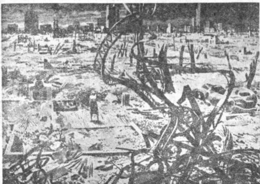
Grozolna razdejavanja po atomski bombi

plaziji atomske bombe in posledicah tega strašnega orožja. Ko boste brali Hersheyjevo reportažo, se vam nobena žrtev ne bo zdela pre-