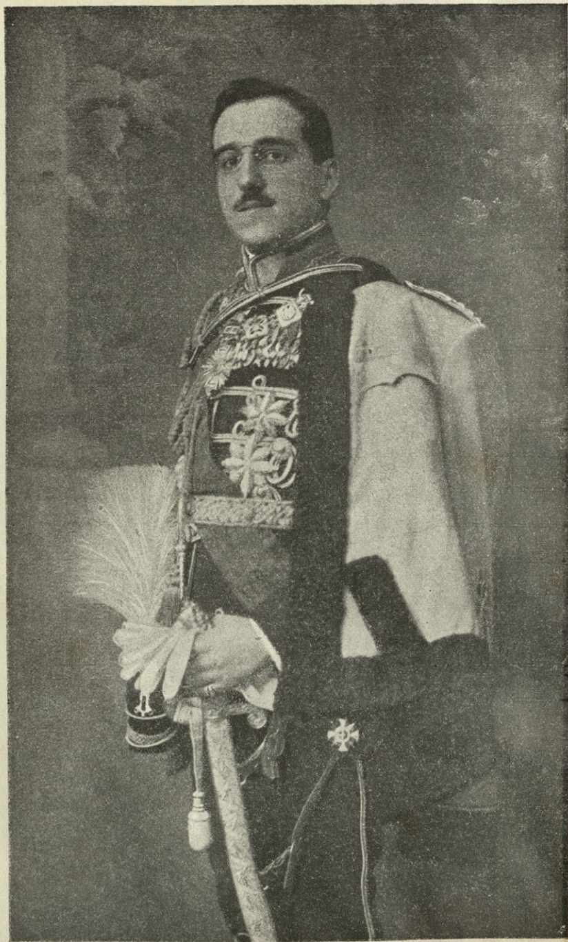
KRALJ ALEKSANDER I.