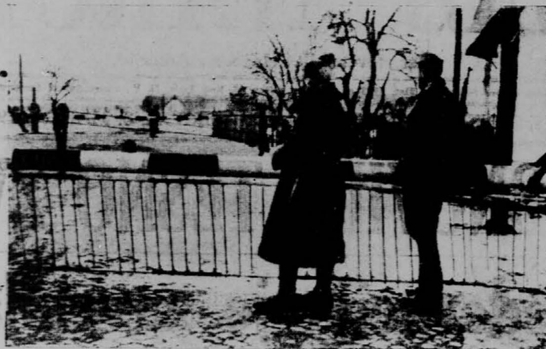
Čehoslovaški vojaki stražijo novo mejo proti Madžarski.