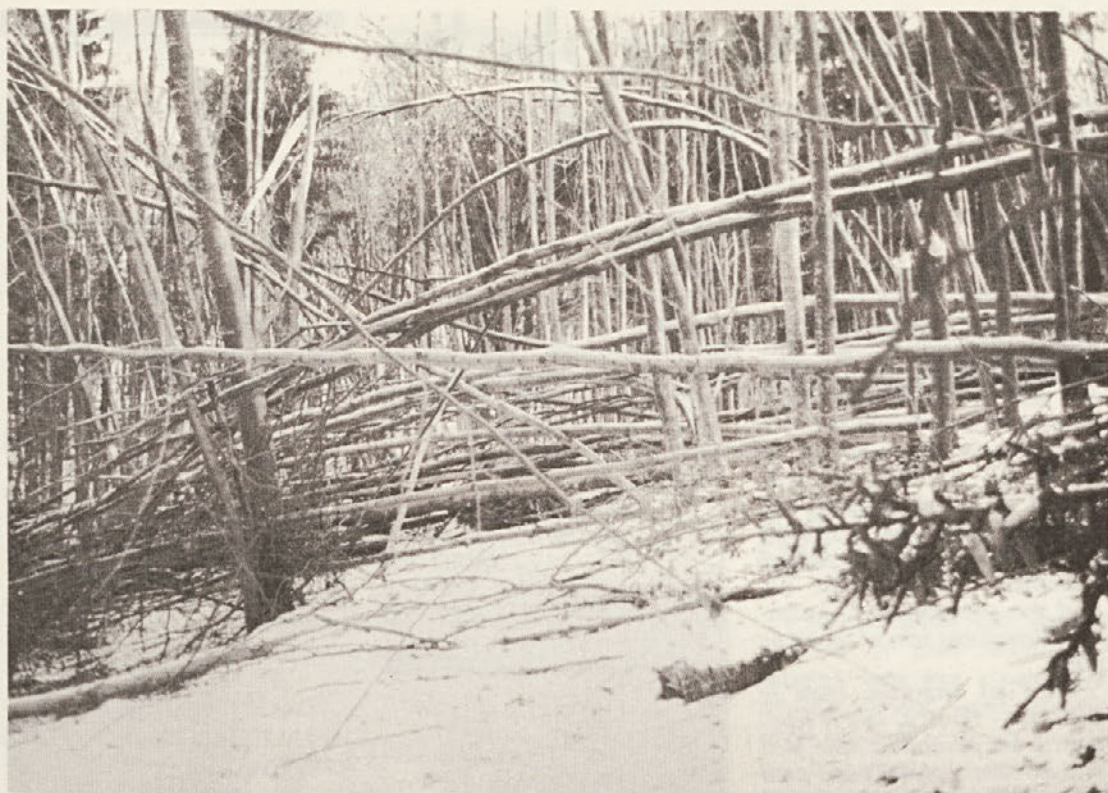
Še en pogled na posledice žleda v Radohi. (Foto: J. Penca).