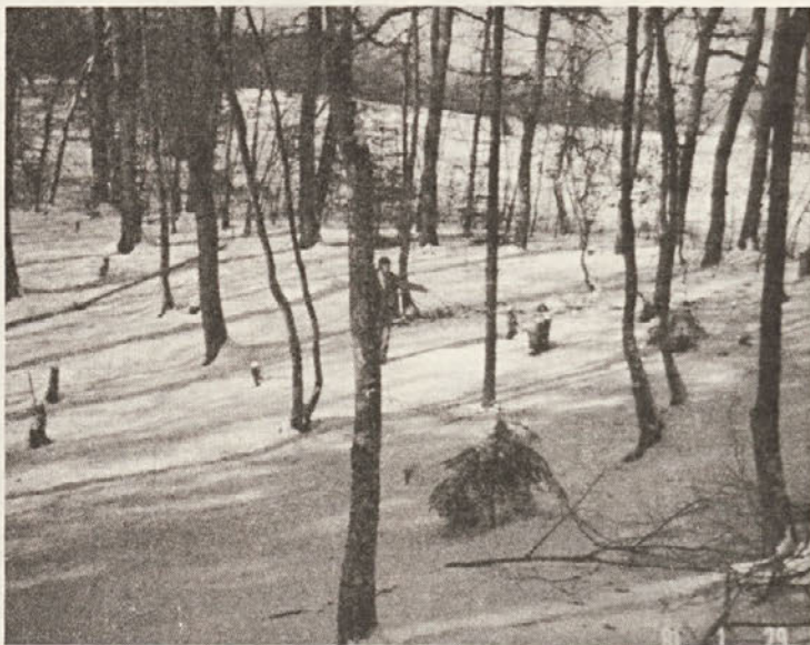
V prejšnji številki smo poročali o škodi, ki jo v gozdu pri Stranski vasi v bližini nekdanje drevesnice povzročajo Romi. Na sliki za njihovo sečnjo značilni visoki panji.