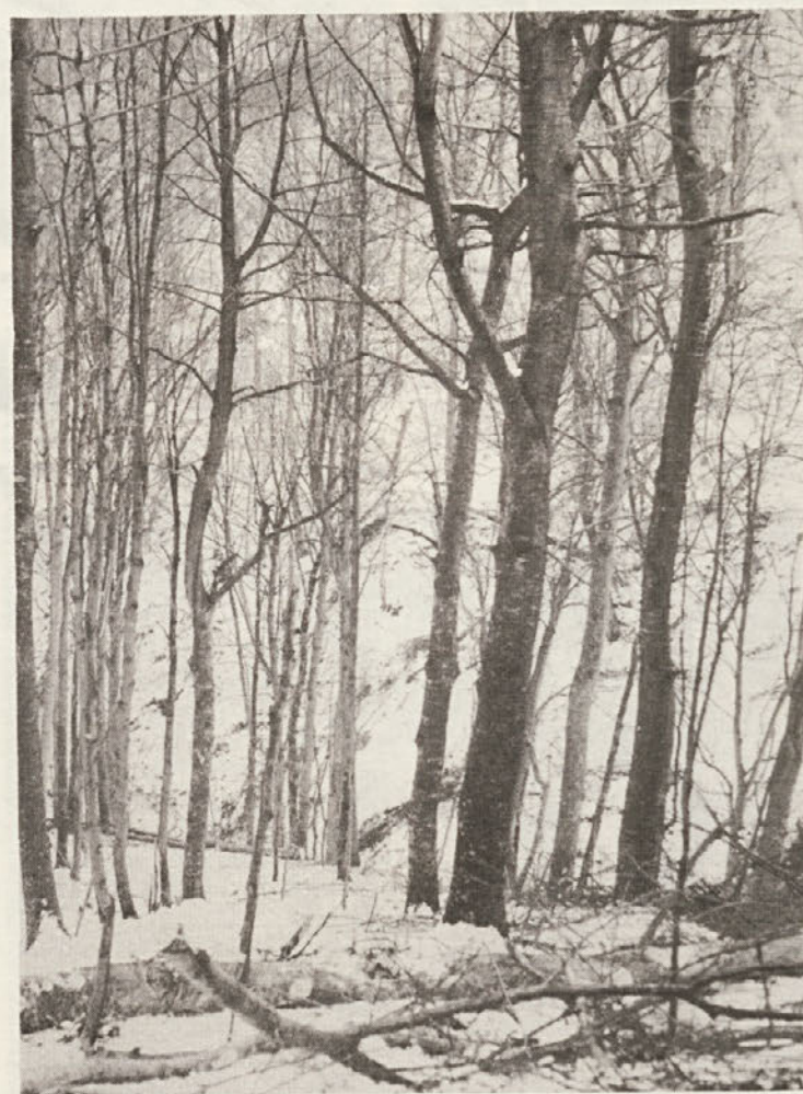
Pogled na sestoj v Prežeku pred posekom. Sestoj pač ni videti lep, a les je razmeroma kar dober. (Foto: J. Penca).

Na Češkem so raziskovali uspevanje macesnov različnih izvorov na področju, ki je ogroženo zaradi industrijskih plinov. Ugotovili so, da so domači macesni bolj odporni. Slabo se je obnesel japonski macesen.