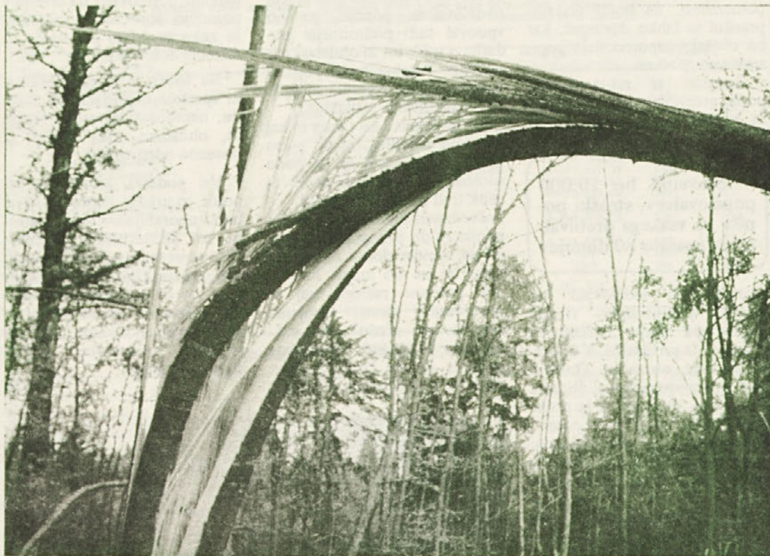
Motiv iz Brezove rebri po novemberskem žledu. Slika zgovorno priča o velikanski sili, s katero je žled razcepil debelo deblo.