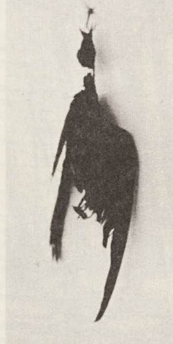
Ribiču se je na grm zapela vrvica z muho. Lastovka je v preletu hlastnila po lažni muhi in obvisela na trnku.