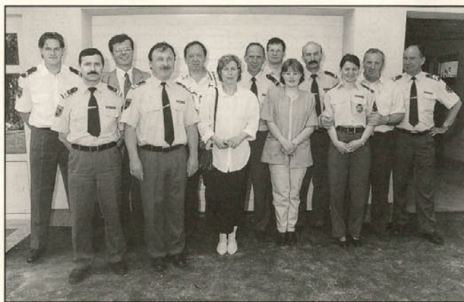
Udeleženci dneva odprtih vrat policije v Vidmu pri Ptujju