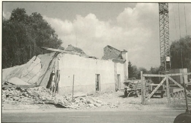
Stara zgradba je bila dotrajana, potrebno jo je bilo porušiti

svet so pred novimi izzivi, med možnostmi pravljanja in čakanja ter hkratnim iskanjem novih rešitev. Ob oceni stanja smo se odločili za nadaljevanje aktivnega dela na projektu in hkratnem reševanju pogodbenih obveznosti s prvotnim izvajalcem. Dela smo nadaljevali z večino pod-izvajalcev pri Korparju direktno in izбором novih izvajalcev za tista, ki niso bili izvedljivi po osnovni pogodbi.