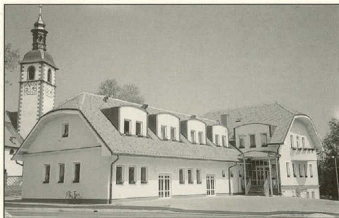
Sedanja podoba nove občinske zgradbe