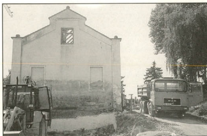
Avgusta 1996 so pričeli z deli ob nekdanji kulturni dvorani

Kljub izjemnim razhajanjem med potrebami in možnostmi smo si v mandatu zadali mnoge velike projekte in to: vodovodno omrežje v vrednosti 130 mio. in za 163 priključkov, cestna infrastruktura v obsegu 27 km in v vrednosti 180 mio. in izgradnja upravne zgradbe, ki je stala 86.500.000 SIT. O izgradnji občinske zgradbe smo se odločili v novembru 1995, ko so se nam ponudile tudi primerne prostorske možnosti.