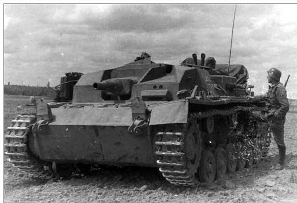
Jurišni top StuG III. Nizko oklepno vozilo brez kupole; na desno strani je videti poveljnika, ki ima pred seboj skarjasti daljnogled, s katerim je opazoval bojišče.

Po invaziji na Sovjetsko zvezo leta 1941 se je pokazalo, da sta nemška tanka Panzer II in Panzer III veliko preslabotna, da bi se postavila v bran novim sovjetskim tankom, famoznim T-34, ki so imeli veliko močnejši top kot tudi debelejši oklep, ki ga standardni nemški protitankovski top Pak 36 kalibra (zgolj) 37 milimetrov nikakor ni mogel prebiti. Zato je nemška orožarska industrija razvila novi, veliko močnejši protitankovski top Pak 40 kalibra 75 milimetrov, ki so ga vgradili v tanke Panzer III in pozneje v Panzer IV. Izkazalo se je, da imajo tudi jurišni topovi v svoji notranjosti dovolj prostora za upravljanje z novim, večjim 75-milimetrskim topom. Zato so ga nemški inženirji vgradili še sem. Novo vozilo se je izkazalo kot učinkovit uničevalec tankov. Ne samo da je bil njegov top dovolj močan, da je lahko uničil nove sovjetske tanke, ampak je bilo tudi podvozje tanka Panzer III zelo mobilno in zanesljivo. Nizko silhueto jurišnih topov StuG je bilo na bojiščih teže opaziti, pa tudi stika med trupom tanka in kupolo, eno od najšibkejših točk, zdaj ni bilo več, saj jurišni top sploh ni imel kupole. Na nasprotnika je bilo treba