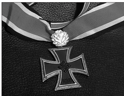
Viteški križec železnega križca s hrastovim listjem ( https://de.todocoleccion.net/militaria-medailen/eichenlaub-ritterkreuz ).

bi lahko svoje dragocene izkušnje v raznih častniških in podčastniških šolah predajali novim generacijam potencialnih junakov, podčastniki pa so bili pogosto povišani v častniške čine. 25