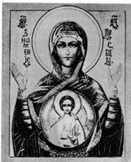
Tuai naši bratje na Vzhodu časté Marijo ...

V uvodu svojih poezij je svoja čuvstva do presv. Zakramenta nekako strnila v te-le besede: »Jezus v presv. Rešnjem Telesu je naša najgorečnejša ljubezen, naše pravo življenje, naša najboljša tolažba, naša najbolj razveseljiva luč. Vse, kar nam o Njem govori in poje, nanj kaže in spominja, je za nas tako ljubo, spodbudno in