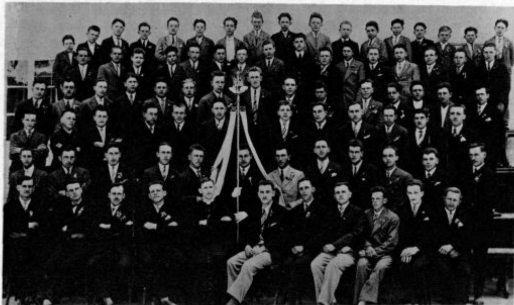
Vzorna Jantovska Marijina kongregacija v Velikih Laščah — z novo zastavo

Vedno sem z zanimanjem odpiral to skrinjico vprašujoče radovednosti. Za kaj se vse zanimajo ti moji ljudje! Vprašanje se vrsti za vprašanjem, skoraj vsakemu se pozna, da je vzeto iz življenja in za življenje, prav malo je takih, da bi jih lahko vrgel med pleve.