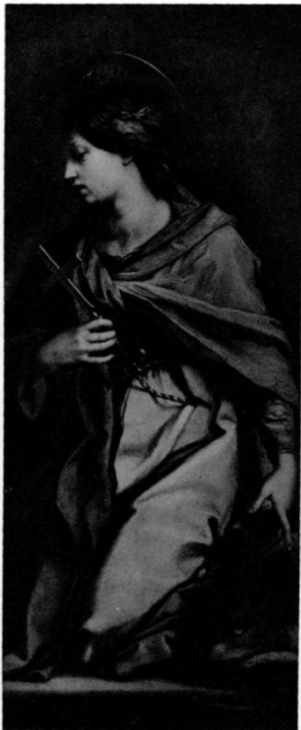
Andrea del Sarto