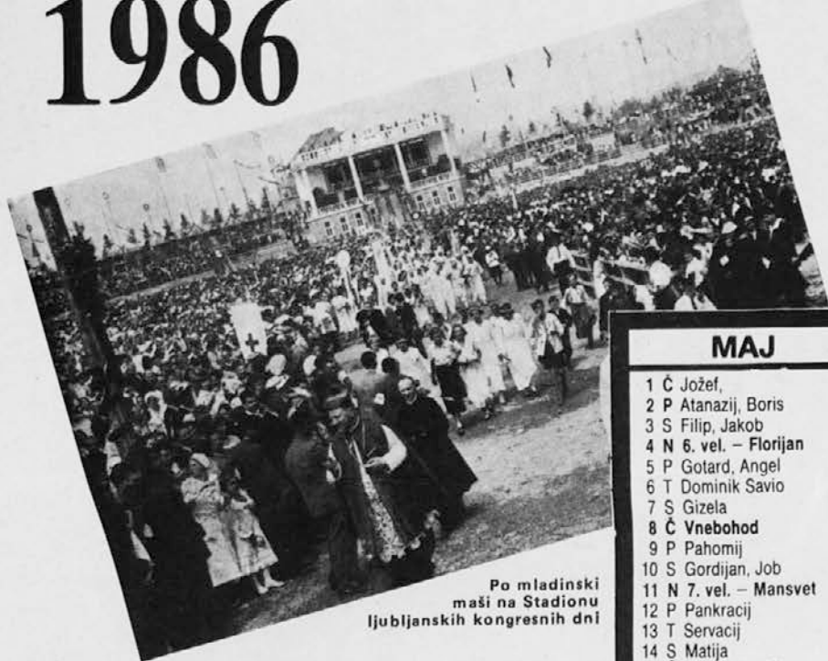
Po mladinski maši na Stadionu ljubljanskih kongresnih dni

POSTNA POSTAVA za avstralske katoličane je sledeča: z držek od mesa in post (pritrganje v jedi) je na pepelnično sredo (letos 12. februarja) in na veliki petek (letos 28. marca). – Na ostale petke cerkvenega leta pa lahko sami izberemo eno od naslednjih oblik pokore: