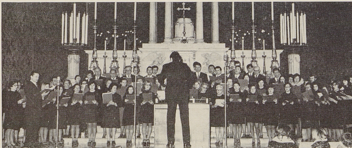
Združeni pevski zbori na lanskem božičnem koncertu v Trstu v cerkvi Sv. Antona Novega.