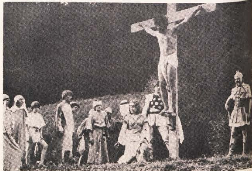
Zaradi velikega zanimanja bo Slovensko prosvetno društvo „Drabosnjak“ na Kostanjah ponovilo

Dokončno dograjeni in z vsemi finesami izpopolnjeni Antoničev tujskoprometni obrat „Rožanski dvor“ je svetel primer, kaj vse zmore človek oz. družina, če se zagriže v delo in stremi za tem, da doseže svoj zastavljeni cilj. Podjetnemu hotelirju z družino želimo še nadaljnjih uspehov. Številnim čestitkam se pridružuje tudi uredništvo Slovenskega vestnika.