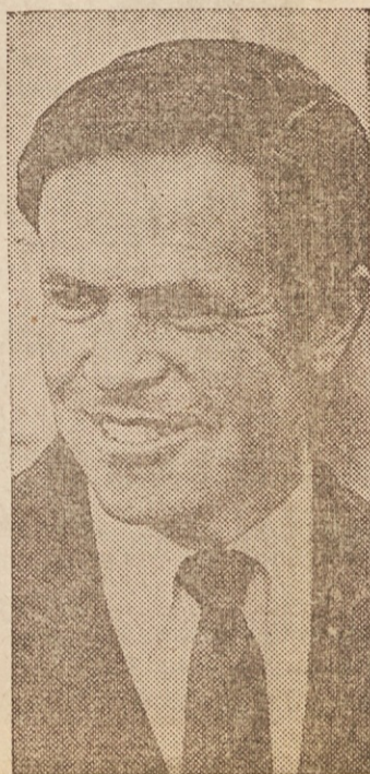
SPREMENJEN — H. R. Halde-man, do lanskega aprila Nixovov glavni pomočnik v Beli hiši, se je pri zadnjem zasedanju v Washingtonu pojavil z novo frizuro, ki je močno spremenila njegov zunanji izgled.