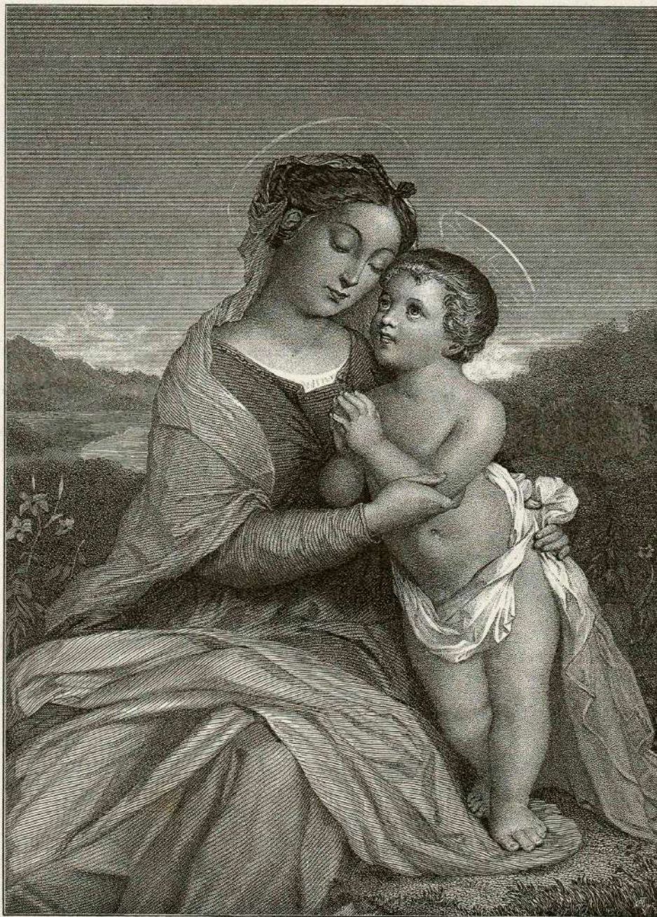
Mati Božja. (Slikal G. Staal.)

Tu le-sem se je napotila Marjetica drugi večer po pogovoru z Marijanko. Šla je urno po kolovozni poti, zatopljena samó v misli o svojem stanu, ne meneč se za nič drugega. Bila