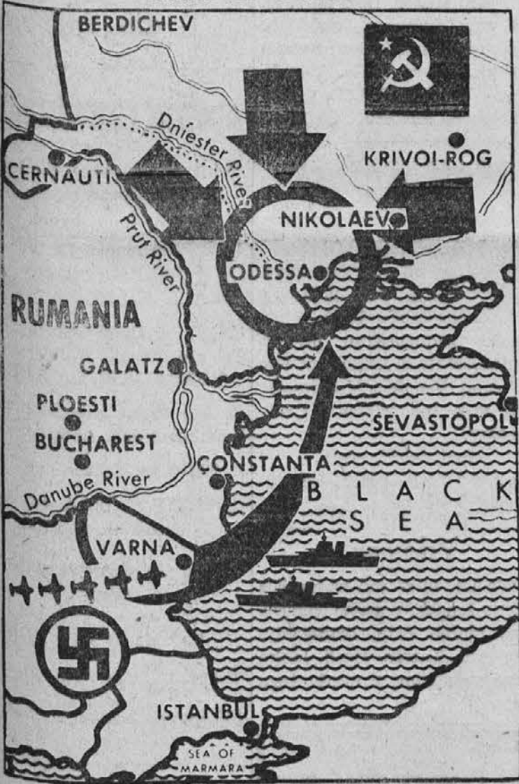
NEW YORK—The Russians closed in on three sides about Odessa, great Black Sea grain port of the Ukraine, and the Germans used desperate measures to rescue whatever they could of the estimated 100,000 troops trapped there. But to no avail. Odessa was taken by the Russians who have also moved into northeastern Romania.