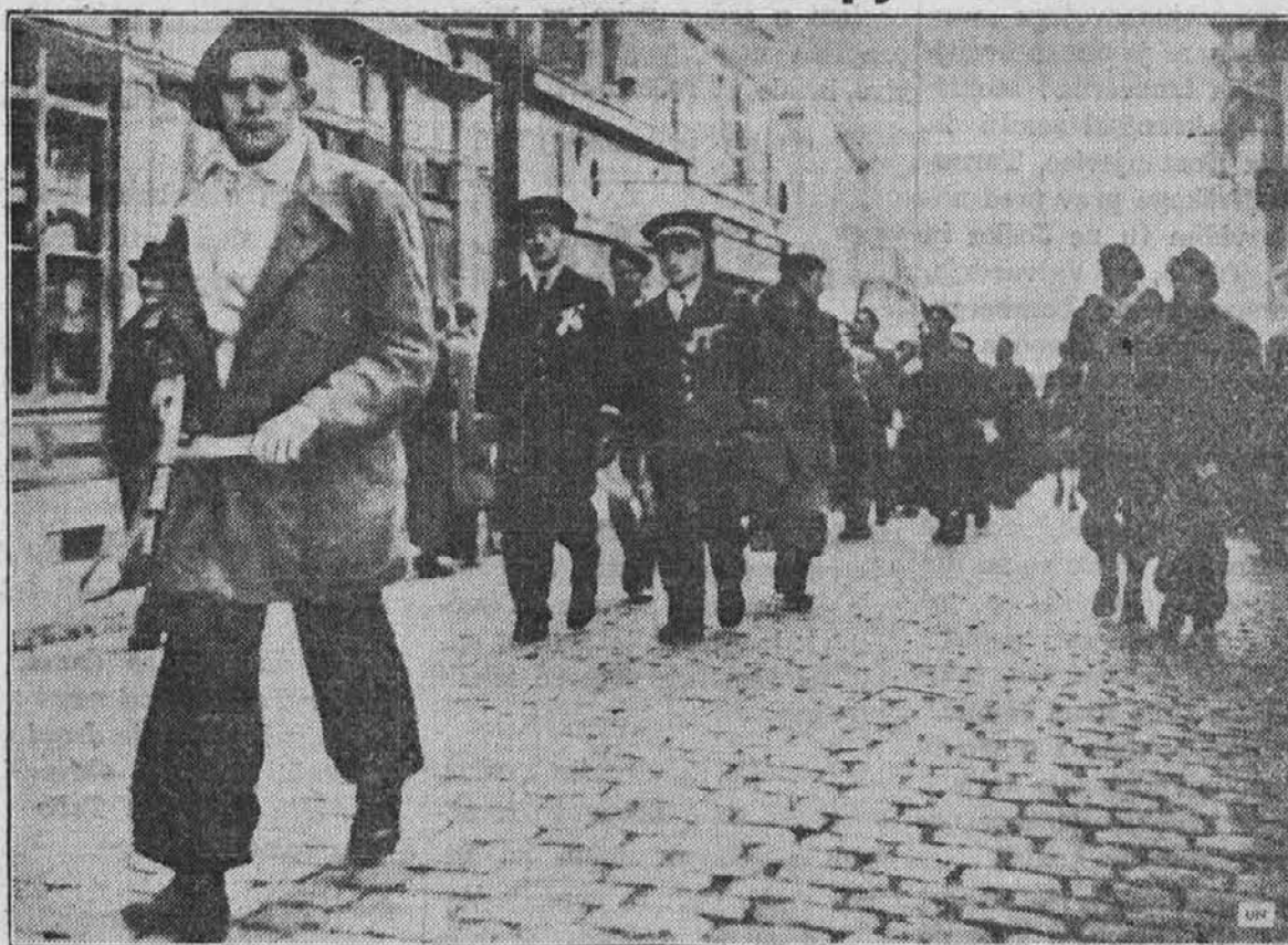
INSIDE FRANCE last year the Maquis—French patriots—celebrated Armistice Day by marching through Oyonnax, small town near the Swiss border, right under the nose of German authorities. This photo has just reached the U.S. from official British sources.

Renzu stvar malo zavlačuje. Pri tej priliki se je spomnil, da manjka le še nekaj dni do časa, ki je za ženitve prepovedan; — in če morem tega pečaka zadržati za teh malo dni, imam potem dva meseca oddiha, in v dveh mesecih se lahko prigodijo velike reči. — Razglabljal je, s kakšnimi pretvezami naj stopi na plan, in dasi so se mu zdeli nekam lahke, se je vendar pomirjal z mislijo, da jim njegov ugled že da pravo tehtovitost in mu njegova stara izkušnost podeli veliko prednost pred tem nevednim mladeničem. — Bomo videli, — je govoril sam pri sebi; — on misli na svojo ljubico, jaz pa mislim, na svojo kožo; najbolj prizadet sem jaz, četudi pustimo to, da sem najbolj oprezen. Dragi sinček, če ti čutiš, da se te loteva ščemenje, ne vem, kaj bi na to rekel; ali jaz se s to ne mislim vtikati. — In ko se mu je tako duh nekoliko ustavil pri takem sklepu, je končno mogel zatisniti oko. Ali kakšno spanje! Kakšne sanje! Razbojniki, don Rodrigo, Renzo, stezice, prepadi, beg, zasledovanje, kriki, streli.