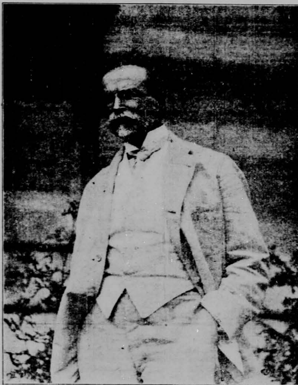
Slika velikega boreca za svobodo in pravico je bila posneta pred dvajsetimi leti v Pittsburghu, ko se je ustanovljala svobodna Čehoslovaška, katero je večeraj fašizem uničil.