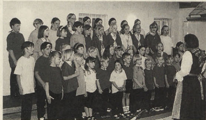
Imamo se fajn – »Mlada Podjuna«