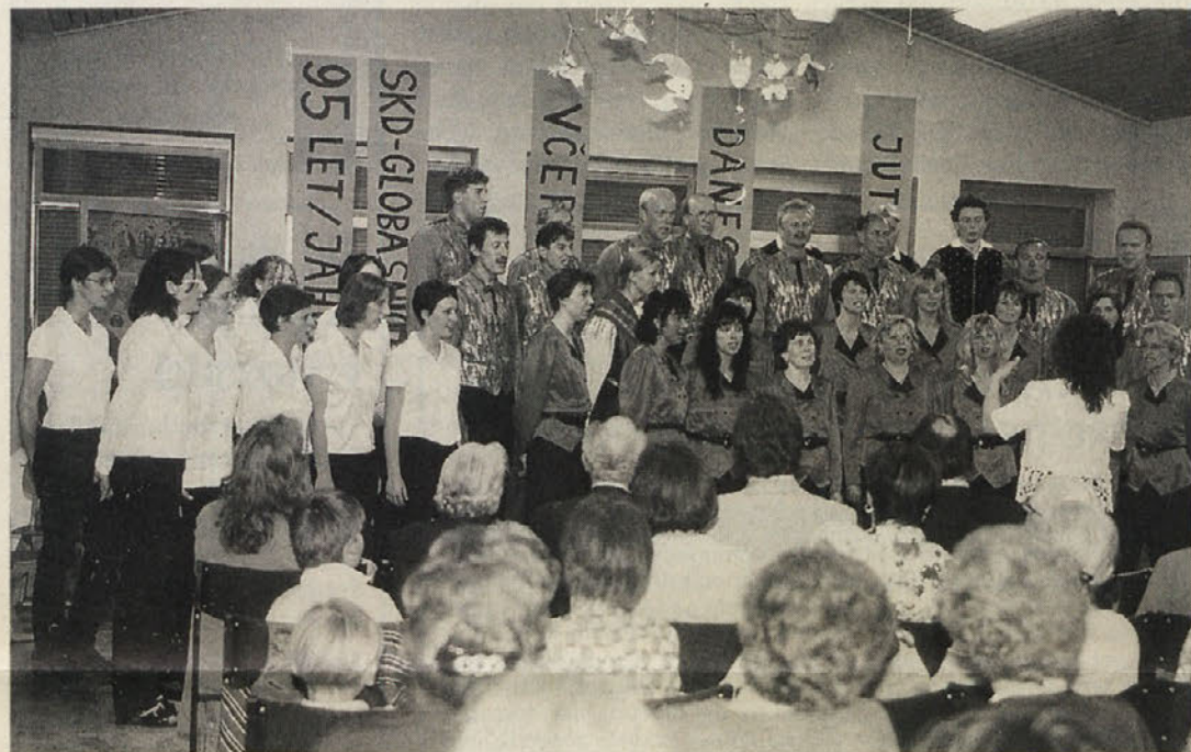
Skupina STEM in Mešani pevski zbor »Peca« sta zaključila jubilejno prireditev

Koncert pri Cingelcu je bil prijetno doživetje za vsakega poslušalca, dobro vzdušje pa se je preneslo na družabnost, ki je seveda v mili junijski noči še posebej zacvetela.