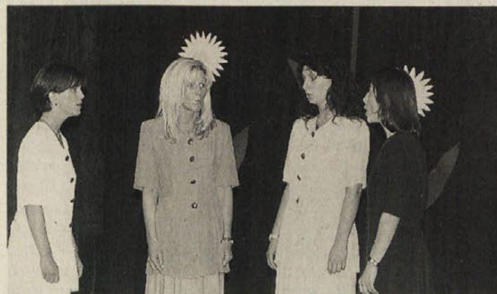
Kvartet »Borovlje«, v ozadju velike marjetice