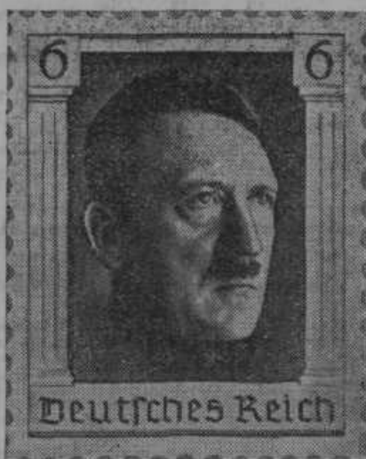
Prvo nemške znamke s Hitlerjevo sliko.

Sv. Jernej pri Ločah. Iz našega kraja se bolj redko poroča, kakor da bi stari dopisniki stopili v pokoj, mladi pa še nimajo korajže, prijeti za