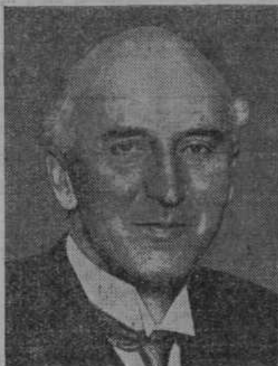
John Simon, bodoči angleški finančni minister, če bo po kronanju kralja Jurija VI. odstopil s Bildwinova vlada.