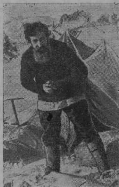
Oton Schmidt, ruski učenjak, se bo odpeljal v letalu v spremstvu 10 strokovnjakov proti severnemu tečaju. Raziskovalci hočejo pristati s pomočjo letal in bodo taborili v najbolj severnih krajih celo leto.

Ljutomer. Občni zbor krajevne kmečke zveze v Ljutomeru se vrši prihodnjo nedeljo 4. aprila ob 9. uri popoldne v Okrajni posojilnici v Ljutomeru. Ker se bo na občnem zboru razpravljalo razen poročila odbora o dosedanem delu, pregledu in odobrenju računov za leto 1936, volitvi odbora za prihodnje leto, o važnih kmetijskih zadevah, se vabijo vsi kmetovalci ljutomerske župnije, da se tega občnega zbora zanesljivo udeležijo! Kmečka zveza je naša najmočnejša stanovska organizacija, zato je dolžnost vsakega kmetovalca, da v njej pridno sodeluje! — Odbor.