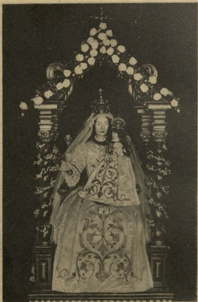
Milostna podoba Marijnega preč. Srca v Mekinjah pri Kamniku.