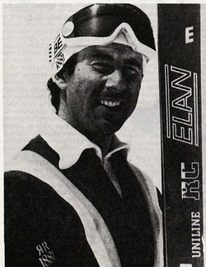
»Srebrni« — Ingemar Stenmark v slalomu in veleslalomu

V smučarski sezoni 1985/86 je bil glavni poudarek na tekmovanjih za svetovni pokal — tako alpski, skakalni, v klasični kombinaciji, tekaški in akrobatski ter na tekaških maratonih. Na vseh teh tekmovanjih so bili tekmovalci z našimi smučmi.