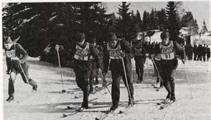
Tekmovanje vojakov z Elanovimi štartnimi številkami na Elanovih smučeh