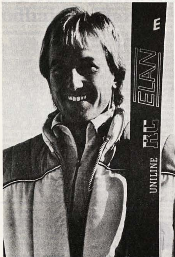
»Srebrni« — Bojan Križaj v slalomu