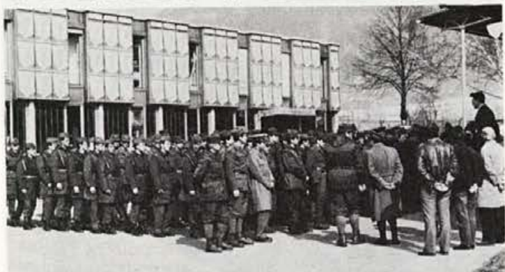
Dolfe Vojsk pozdravlja vojake — smučarje v Elanu pred armijskim tekmovanjem na Pokljuki