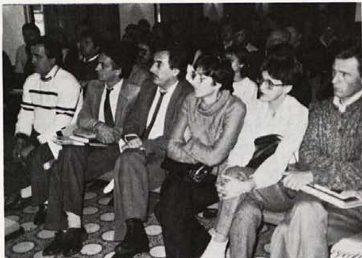
Zbranost in zagnanost sodelujočih se bo odrazila pri prodajnih uspehih