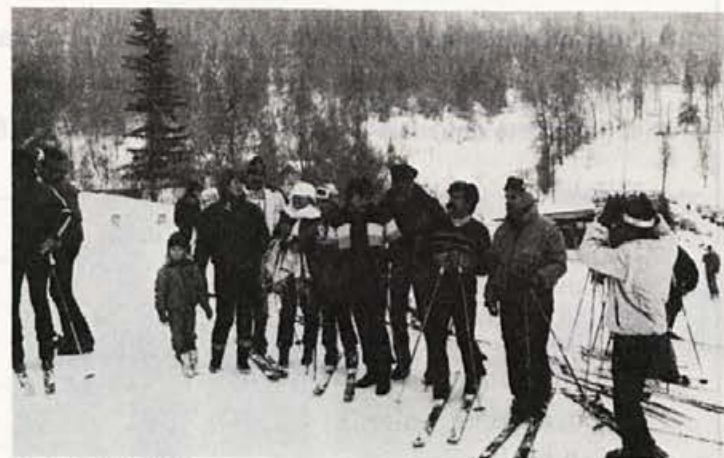
V cilju (Krpina)

V petek popoldne, natančneje zadnji dan v februarju, smo se zbrali »soborci« za prodajnimi pultu in tekmeči na dilcah štirih trgovinskih delovnih organizacij — Jeklotehne Maribor, Kovinotehne Celje, Metalke Ljubljana in Merkurja Kranj na zimsko-športnih igrah — ŠIT '86.