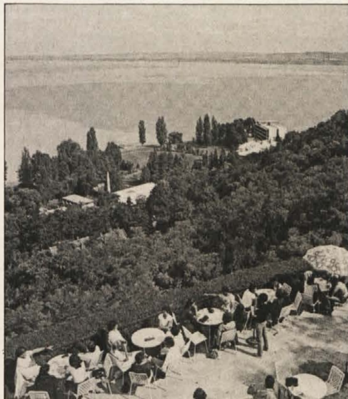
Cilj letošnjega hita Slovenskega vestnika: Blatno jezero.

V Ženevi so medtem na zasedanju Liberalne internacionale (LI) ponovno zahtevali izključitev Haiderjeve svobodnjaške stranke.