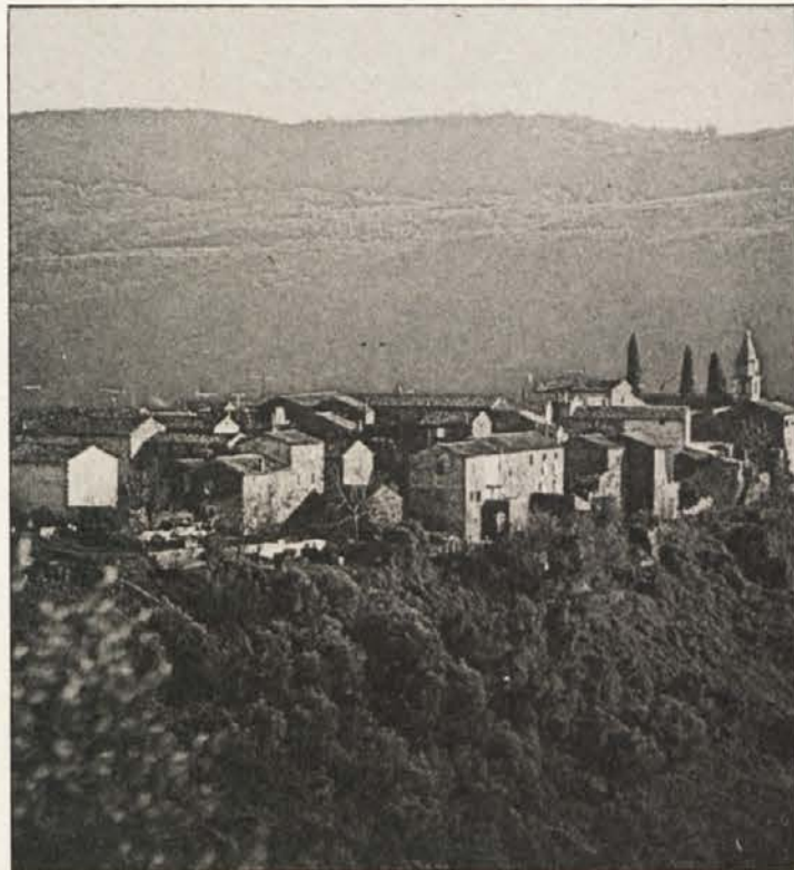
Zasanjana vas v Istri

Poleg turizma v ožjem pomenu pa imajo ob slovensko in hrvaško-istrski obali največjo škodo kmetje in obrtniki. Kmetje so spet posadili normalne količine povrtnin – paradižnika, paprike, kumaric, lubenic in drugega obmorskega sočivja. Letina je dobra, kupcev pa malo. Na trgu se stojnice šibijo pod vsemi temi dobrotami, zvečer pa skoraj vse spet pripeljejo domov. Pravijo, da bo drugo leto veliko pancete in prušta, kajti kdor ima možnost, z vsem tem krmi prašiče. Kupna moč prebivalstva je