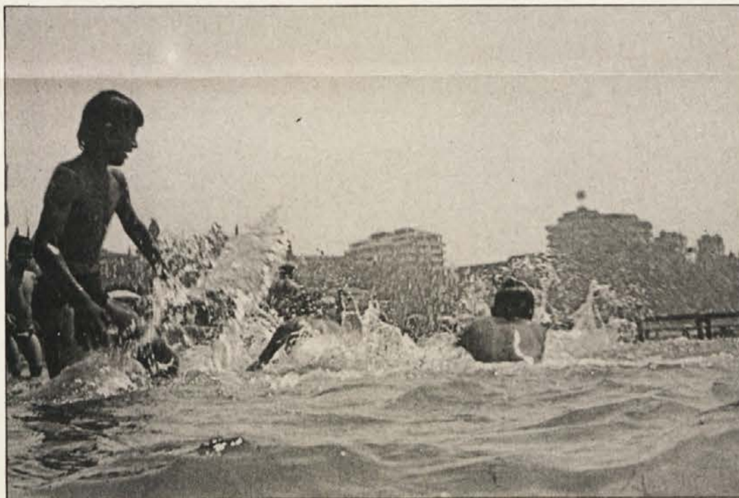
Otroci kljub vsem uživajo Jadransko morje