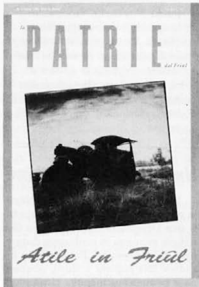
Naslovna stran revije »La Patrie dal Friûl«