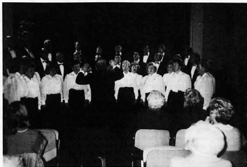
Zbora »Tabor« v mešani zasedbi na prazniku ob 60-letnici dirigenta

Tudi ženski pevski zbor, ki deluje v okviru društva, je zelo aktiven. Veliko je že nastopal doma in v tujini, poje na raznih vaških prireditvah, obenem pa prireja srečanje ženskih zborov z naslovom »Zapojmo si pesem veselo«,