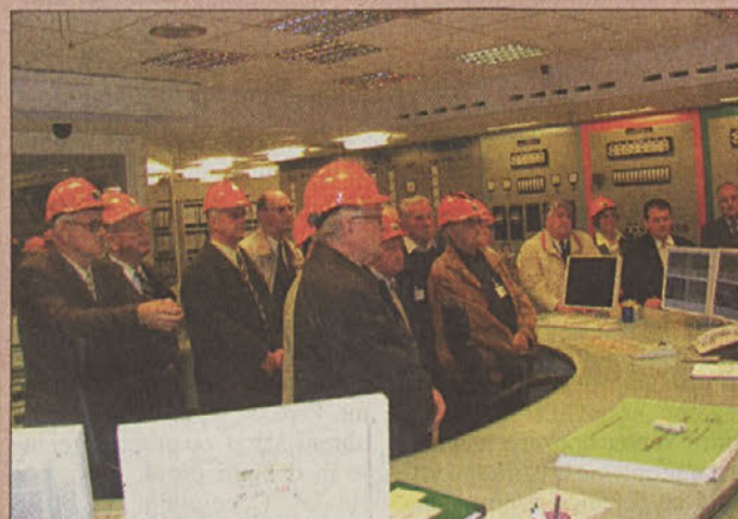
Seniorji v nuklearni

Rudnik je z zadevo Bonpet seznanil tako prejšnjo kot sedanjo vlado. Prejšnja ni odregirala. Bo sedanja? B.D.