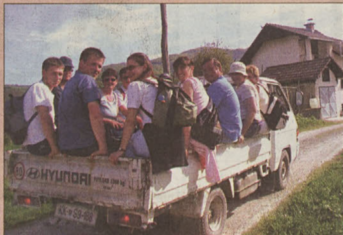
Poštenovaščani se vračajo s Planine