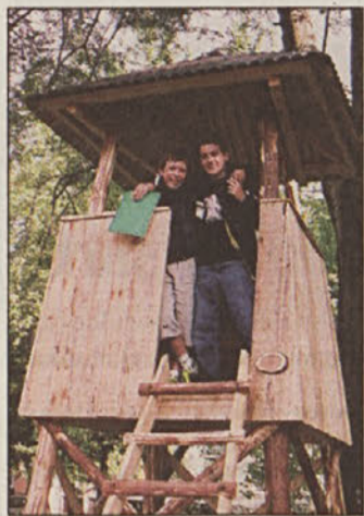
Učenci so peizkusili lovsko prežo.

v šoli" (otroci imajo to sadje na šolskem jedilniku kar trikrat na teden, izdali so tudi knjigo receptov), vrhunec druženja ob dnevu šole pa je bilo odprtje učilnice v naravi, ki je (predvsem občino) stala 5 milijonov SIT. V Posavju in menda tudi v Sloveniji edinstveno pridobitev za naravoslovni pouk so uredili domači gozdarji, sadjar-