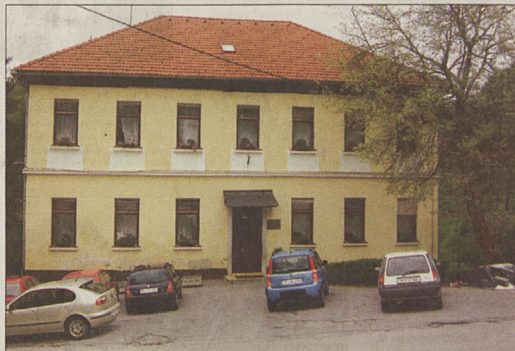
Če ne bo prišlo kaj vmes (nikoli se ne ve), bo stara (šola) končno dočkala podmladek (prizidek).

S sklepom o ohranjanju mreže šol v občini, a prepotrebni spremembah, ki so bodo kazale tudi v spremembi šolskih okolišev, so svetniki dregnili v osje gnezdo. Šolniki, za katere občina trdi, da so sodelovali pri analizi, se jezijo, da so za spremembe zvedeli iz medijev. OŠ Boštanj trdi, da so podatki o desetih praznih učilnicah na šoli iz trte zviti, podružnična šola Studenec protestira, ker naj bi ta šola po novem sodila pod Boštanj in ne več pod Sevnico, v Loki želijo dozidati šolo, kar jim je župan celo obljubil, čeprav niso v nobenem planu, OŠ Blažca čaka na most preko Save, po katerem bodo k njim