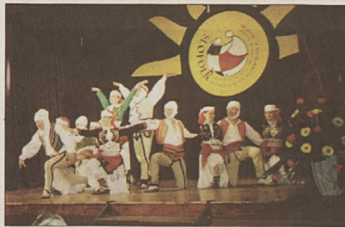
Atraktiven nastop Folklorne skupine Tirana iz Albanije

Artiče – Na pobudo štirih folklornih skupin – Kres iz Novega mesta, Račna pri Grosupljem, Vidovo iz Šentvida pri Stični in KUD Oton Župančič iz Artič se je prvič v Sloveniji zgodil mednarodni folklorni festival – imenovan SLOFOLK. Cilj festivala je bil kulturno združevanje Evrope, kar seveda ni naključje, saj je 1. maja minilo eno leto od vključitve Slovenije v evropsko družino narodov. Vsaka od omenjenih skupin je na festival pripeljala eno tujo skupino in tako so na tokratnem festivalu sodelovale folklorne skupine iz Albanije, Italije, Makedonije ter Srbije in Črne gore. Vsak večer so svoje plesne, ob tem pa tudi kulturno dediščino svoje dežele, predstavili v drugem kraju; prvi večer so nastopili v Novem mestu, drugi večer v Račni pri Grosupljem, tretji večer v Šentvidu pri Stični, zaključek festivala pa je bil v Artičah.