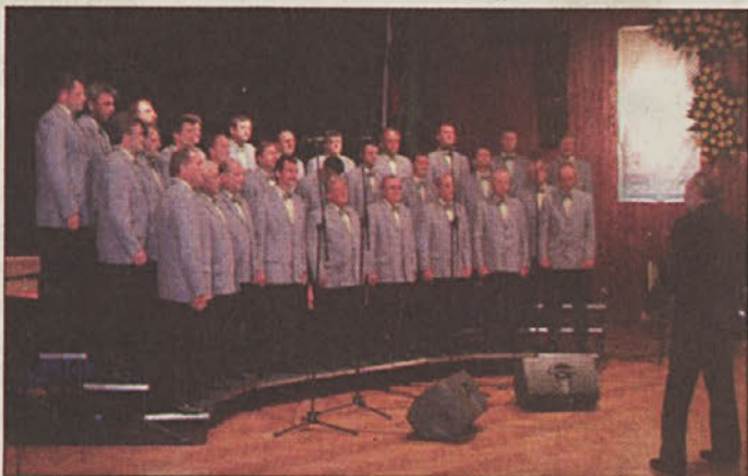
Moški pevski zbor Svoboda iz Brestanice