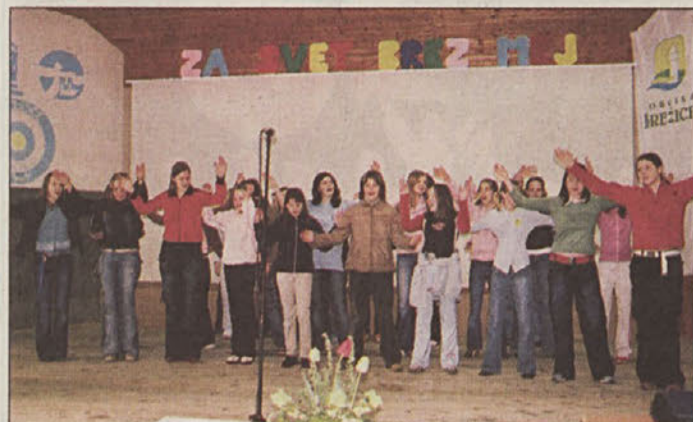
Mladi iz "posinovljenih" šol so nasmejanih lic zapeli Unescovo pesem prijateljstva