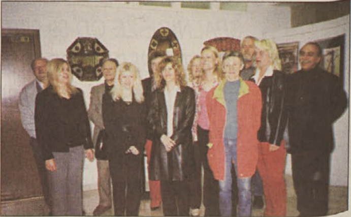
Člani Likovne družina KD "Franc Bogovič" Dobova