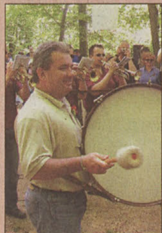
Minister Vizjak z bobnom

Bili so prazniki in vihrale so zastave; ob dnevu upora proti okupatorju jih je bilo mnogo manj kot ob mednarodnem prazniku dela. In bili so govori, ponekod preveč prazni in brez vsebine, drugod spet predolgovezni in politično naravnani. In ljudje so postavljali mlaje, ponekod nižje, drugod takšne za prestiž in z vseh so vihrale slovenske trobojnice, ki so se jim ponekod pridružile tudi zastave nove Evrope. Delavski praznik živi dalje, četudi so mnogi ostali brez dela in delavskih knjižic, tako kot je brez ene same sveče ali drugega spomina ostal spomenik sredi Dobrave!