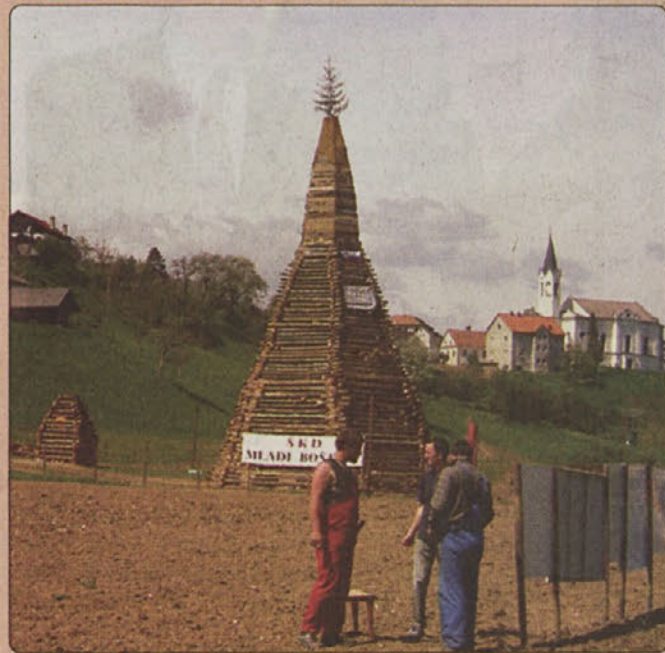
Kupola najvišjega kresa v državi je kar malce konkurirala zvoniku boštanjске cerkve.

Pokrovitelj podviga je bila Občina Sevnica, Krajevna skupnost Boštanj in posamezniki, ki so pomagali z delom. Med njimi Zidarstvo Jazbec, saj brez njihovega dvigala vrh kresa ne bi krasila tako lično postavljena kupola. B.D.