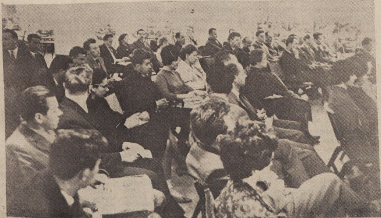
S konstituiranja občinske skupščine v Festivalni dvorani