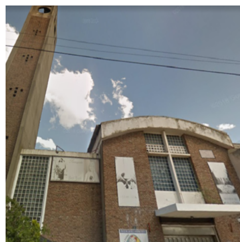
Cerkev sv. Jožefa Pompejskega