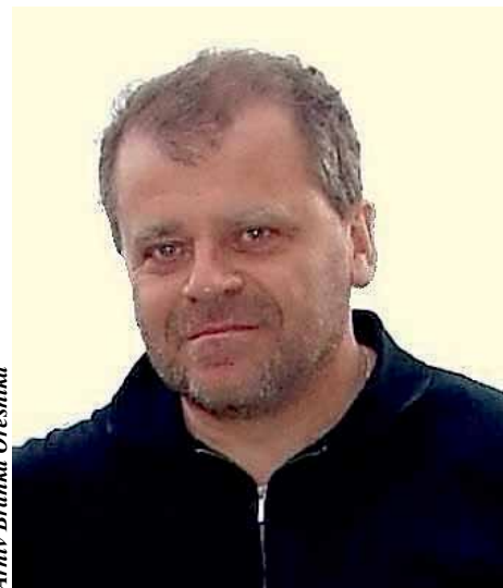
Arhiv Branka Orešnika