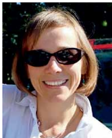
Spoštovane bralke, spoštovani bralci!