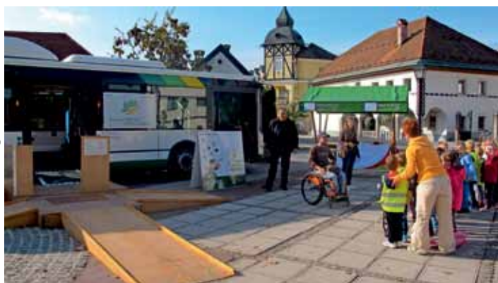
Avtobus na metan in prikaz ovir za invalide v prometu

V soboto je organizatorju dogodka Pazi! Poglej! Poslušaj! Nosi čelado! ponagajalo letošnje spremenljivo vreme, tako da prireditev na prostem ni bila izvedena, je pa MŠKD Dlan na dlan s svojimi predstavniki ter Dlančki in Dlančicami ob tednu mobilnosti vseeno pripravilo poligon v notranjih prostorih društva za vse, ki jih slabo vreme ni odvrnilo od udeležbe. Naučili so se, kateri znaki ukazujejo ali celo prepovedujejo. Skozi igro pa so spoznali, kako pomembna je varnost na cesti in ob njej. Vsi, ki so pokazali veliko truda, pravilno odgovorili na vprašanja prometnega kolesa in imeli nekaj sreče, pa so lahko prejeli praktične nagrade.