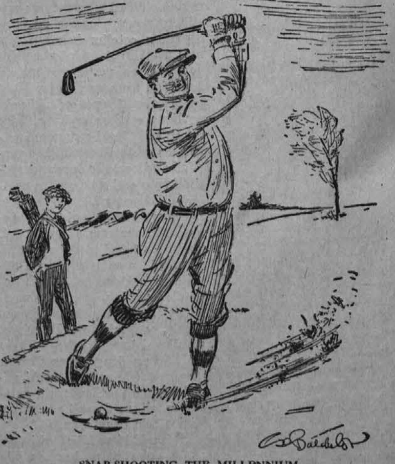
SNAP-SHOOTING THE MILLENNIUM "Oh, mercy! How provoking!"