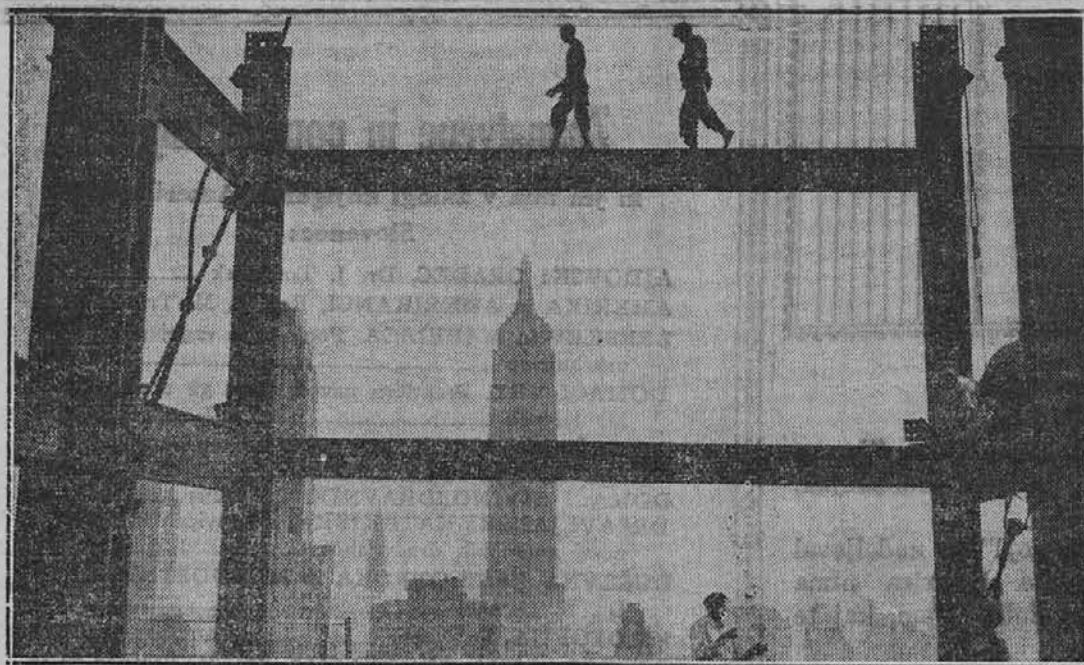
Slika nam kaže dva delavca v vrtohlavi višini, ki sta zaposlena pri gradbi nekega 70nadstropnega poslopja v New Yorku. V ozadju se vidi nebotičnik Empire State Building.