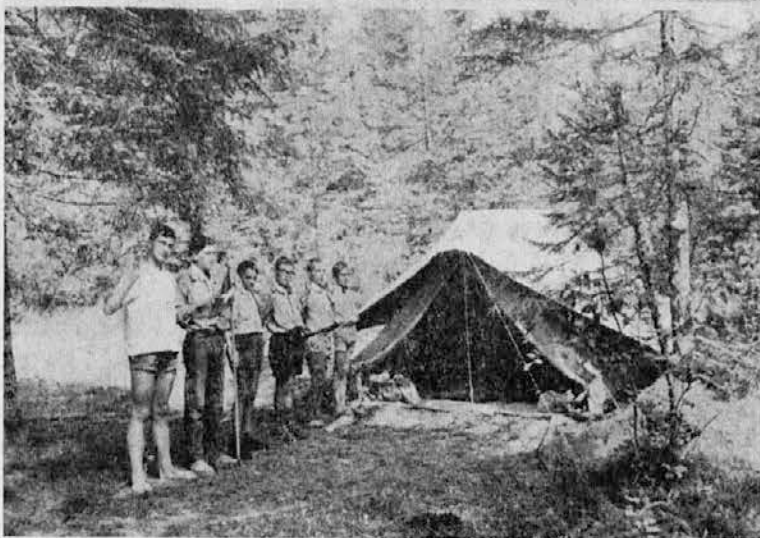
Z letošnjega taborjenja goriških skavtov v Zajzeri: sv. maša sredi božje narave; spodaj: jutranji pregled šotorov

toda njegovi živci so izčrpani in tako dirka mrzel in čemeran mimo nekaj cerkv. Na tihniku še čuti ostro bolečino bolečnega prijema in ta bolečina ga žene dalje, dokler ne pride pregnan do Wolveste in se obu in oblečen ne vrže na posteljo, nem za Greetina vprašanja in nem za njen strah, ki ne razume, kaj mu je.