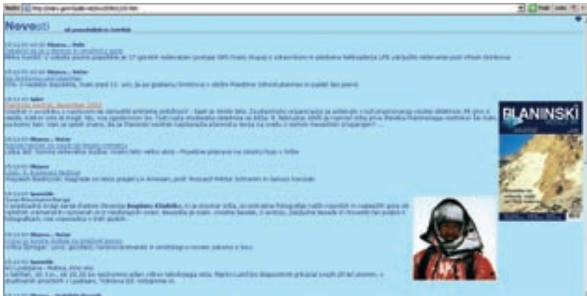
Nekdanja spletna stran GORE ... LJUDJE

hrvaškega plezalca, ki je poročal o vzponih v Paklenici – pa so potem dokazali, da tistega ni splezal. Moram priznati, da sem bil večinoma preveč zaposlen, da bi lahko preverjal vsako poročilo. Vse to sem namreč počel ob svoji redni službi! Vmes sem tudi vodil INDOK službo Planinske zveze Slovenije, kjer smo želeli arhivirati vse podatke. Žal je to delo zamrlo in podatki so se porazgubili ... Z vsem tem je bilo res veliko dela!