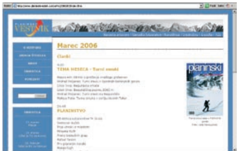
Spletna stran Planinskega vestnika

Ja, no ... Zaenkrat še ni tako razvit, da bi bil lahko finančno zanimiv. Povpraševanje je premajhno. Dolgo časa sem moral sam financirati vse tole delo. Ko smo se razvijali, se je sčasoma pokazalo, da le imamo nekaj reklamnih pasic. Ker je bilo za to treba izstavljati račune,