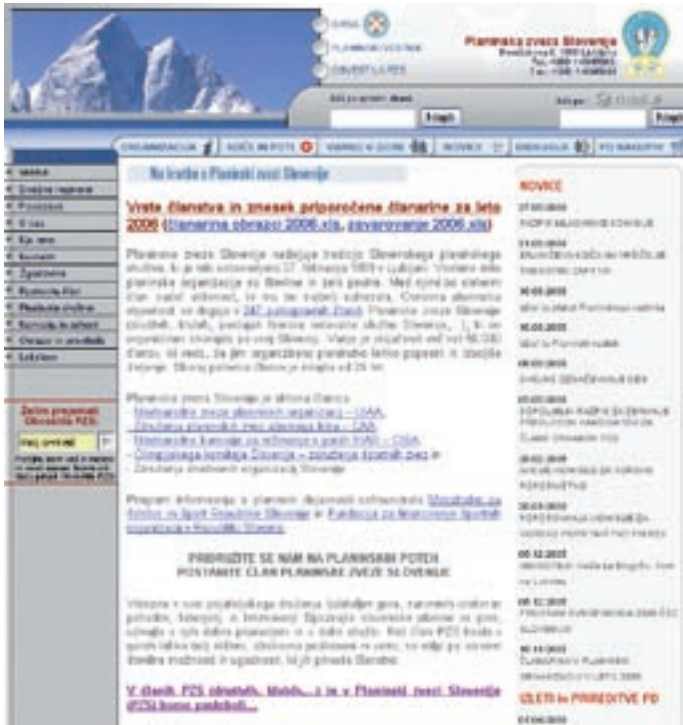
Spletna stran Planinske zveze Slovenije

V teh primerih gre običajno za osebne strani posameznikov ali odprav. Mi nudimo samo povezave na njihove strani. Poobjavimo seveda precej. Ampak marsičesa, kar ti posamezniki tlačijo na svoje spletne strani, jaz osebno ne bi dajal na splet. Je pa internet omogočil nekaj povsem novega: sediš doma ob računalniku in spremljaš alpinista, ki prav tisti hip visi nekje v steni. Zdaj se jasno kaže, da je spletno poročanje pred drugimi: celo pred radijskim, pred televizijskim pa sploh. Vsak hip lahko od koder koli interaktivno in multimedijsko poročate. Tega nima noben drug medij. Prej so ta medijski pritisk doživljali recimo nogometaši ali pa smučarji na tekmovaljih. No, zdaj to doživljajo tudi alpinisti. Seveda tisti, ki to hočejo. Pred nekaj leti smo imeli okroglo mizo o poročanju o alpinizmu in o stikih z javnostjo. Takrat so strokovnjaki opozarjali alpiniste, da čisto gotovo s po-