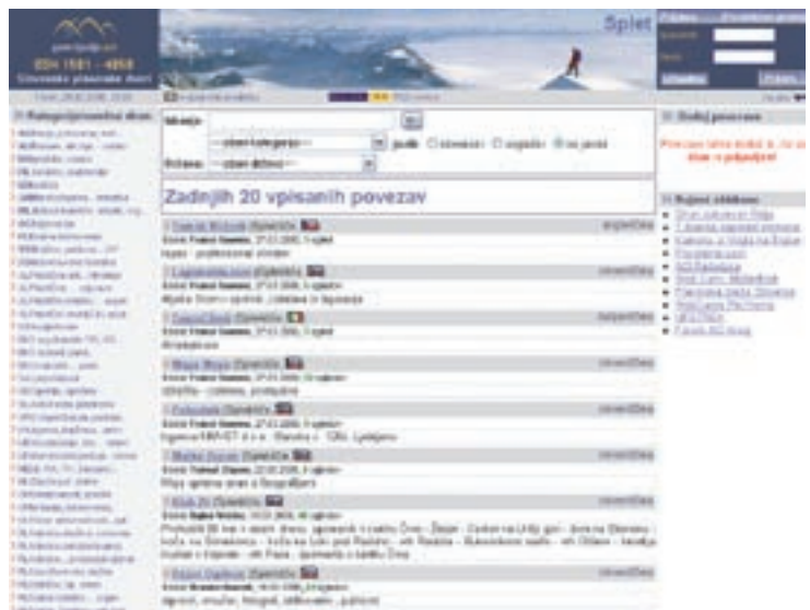
Spletna stran Planinske povezave

Sem in tja še, seveda! Ko pridem s ture domov, se je pa treba zvečer usesti za računal-