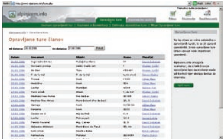
Spletna stran Alpinizem.info

ročanjem ne bodo zmeraj zadovoljni. Alpinisti bi najraje medijsko pozornost samo takrat, kadar jim to ustreza – večinoma takrat, ko jim kaj uspe, in pa zato, da pridobivajo pokrovitelje. Ampak mediji ne delujejo tako: mediji iščejo in objavljajo tudi problematične stvari, stiske, škandale. Stiska v steni je za medije še zanimivejša kot uspeh nekega vzpona. Tako je in to moramo pač sprejeti.