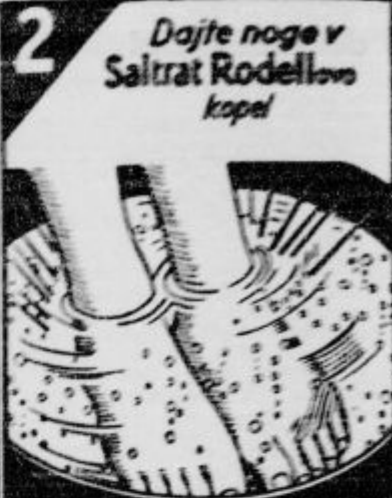
2 Dajte noge v Saltrat Rodellovo kopel