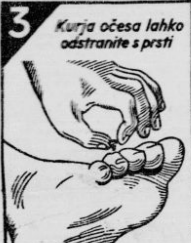
3 Kurja očesa lahko odstranite s prsti