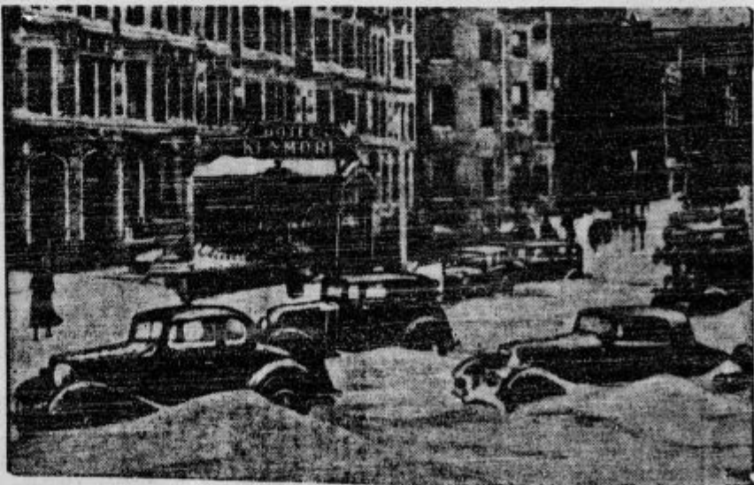
Prva slika velikanskih snežnih zametov, ki so meter na debelo pokrili Severno Ameriko. Na sliki vđimo prometno ulico v Bostonu, kjerje v zametih običajno vse polno avtomobilov.