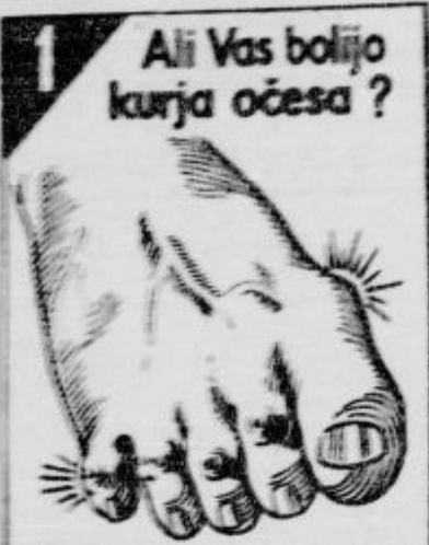
1 Ali Vas bolijo kurja očesa?

zanimajo, predvsem tiste, ki želijo objaviti kratke oglasne besedila. Če imate kaj zanimivega, nam ga pošljite, bomo se trudili, da ga objavimo. Oglasnine so zelo nizke.