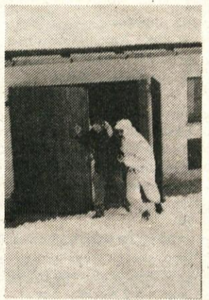
Po vpadu v objekt je bil »sovražnik« prijet in odveden pred nosom »sovražnikove« policijske postaje.