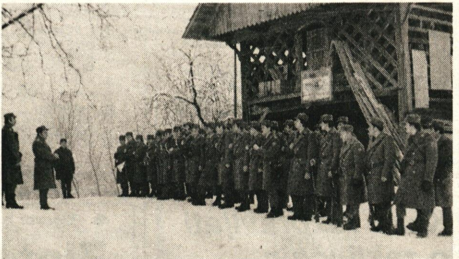
Vaja je zaključena. Potrebno je narediti analizo in oceniti uspeh vaje in opozoriti na napake.