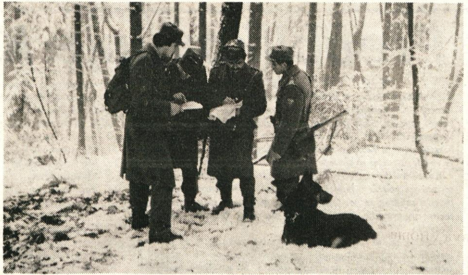
Na zasneženem terenu je potrebno dobro proučiti karto, narediti načrt pohoda in plan akcije.