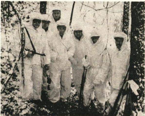
Še en posnetek pred zaključnim delom akcije. Maskirne obleke v takih vremenskih pogojih pridejo še kako prav.