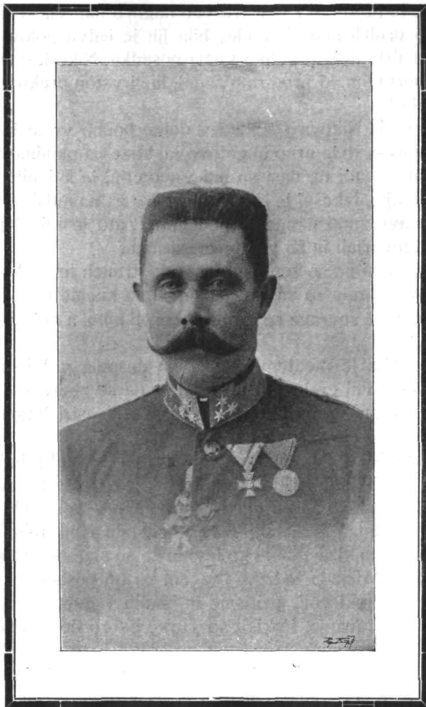
Nadvojvoda Franc Ferdinand,