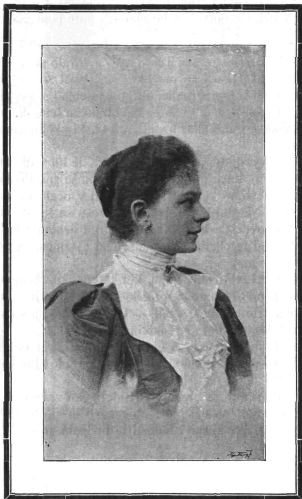
† Vojevodinja Zofija Hohenberška, soproga † prestolonaslednika