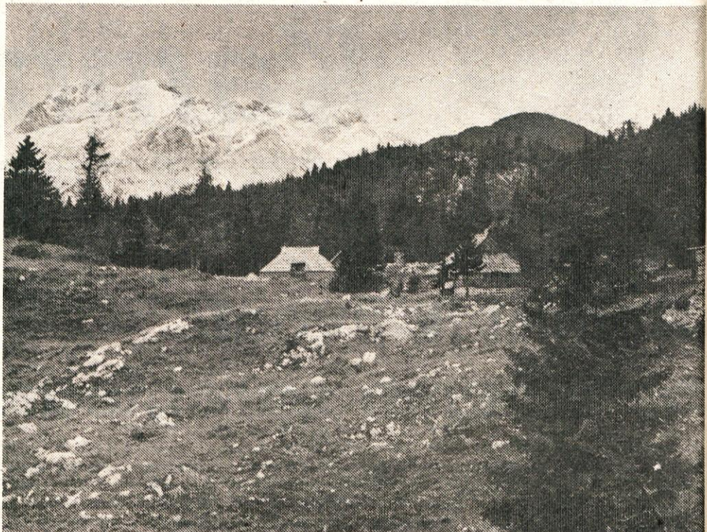
Petnajst let smo čakali na Viatorjeve razvojne programe letnega in zimskega turizma na Veliki planini – zdaj nas hočejo »obdarovati« z izrabljeno žičnico, ki že ves mesec stoji in zapira lepote Velike planine pred obiskovalci

Ena največjih težav našega gostinstva pa je pomanjkanje strokovnega kadra. Gostinstvo je razdrobljeno, neorganizirano. Res je, da so osebni dohodki delavcev v gostinstvu sorazmerno slabi, res pa je tudi, da bi bili veliko boljše, če bi goste vabili in jim postregli kot je treba, da bi prišli še drugič in tretjič, ne pa enkrat samkrat in zadnjikrat, kot v Malograjskem dvoru. Prav za-