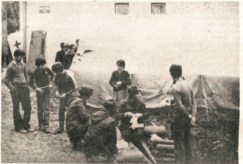
Dislocirana zdravstvena postaja pod šotorom je sprejemala ranjence iz več krajevnih skupnosti. Zdravniki so kontrolirali pravilnost dela enot prve pomoči.