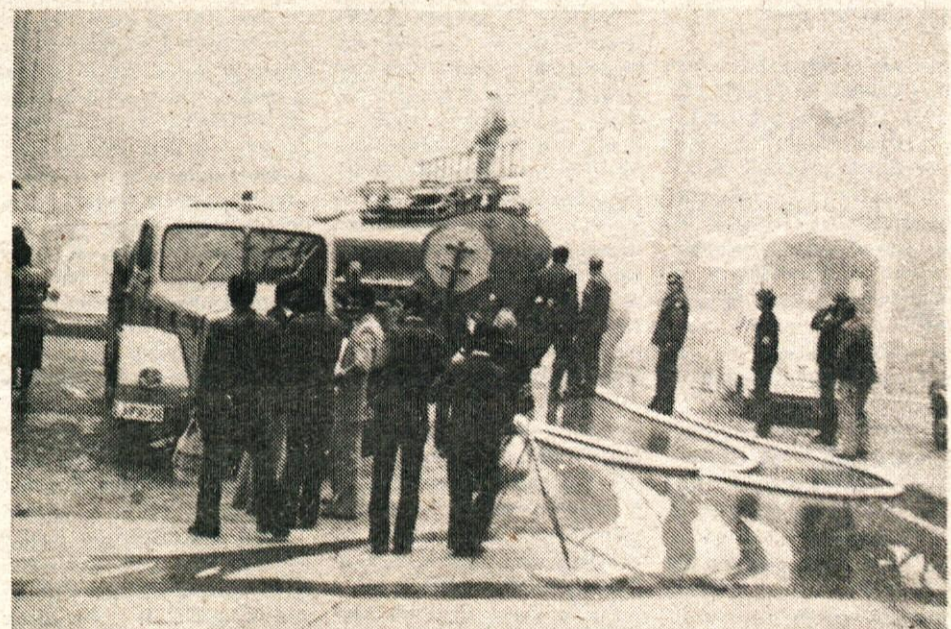
Ekipa za reševanje izpod ruševin čaka da gasilci ukrotijo požar.