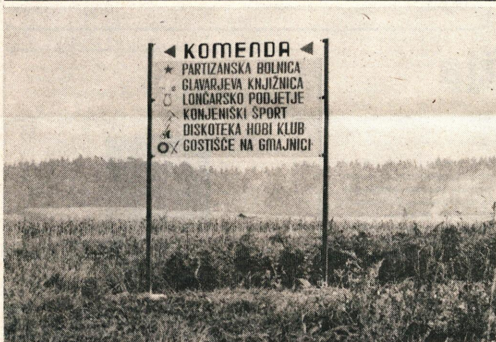
Ob vpadnicah v Komendo lične in različne table opozarjajo na spominska obeležja in pomembne dejavnosti tega kraja.