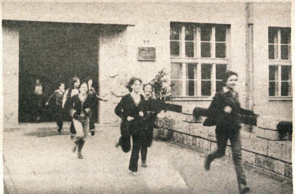
Učenci osnovne šole Toma Brejca so se morali zaradi nevarnosti zračnega napada umakniti iz šolskega poslopja skupaj z učitelji. Šolsko poslopje je bilo prazno v dobrih dveh minutah. Pri tem so pomagali tudi pionirji prometniki.