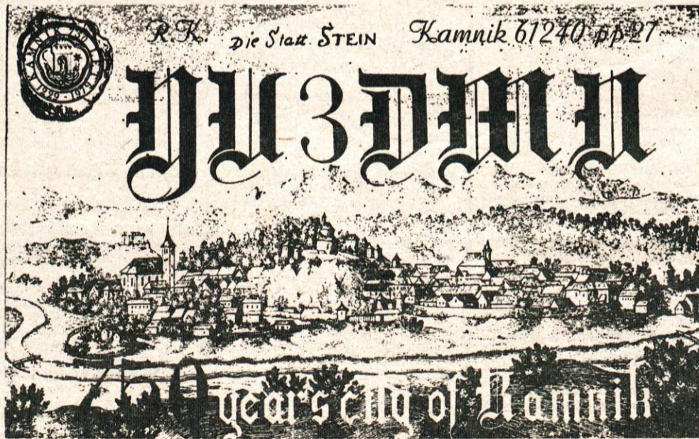
Kartica, ki jo v počastitev 750-letnice mesta Kamnika pošiljajo v široki svet radioamaterji