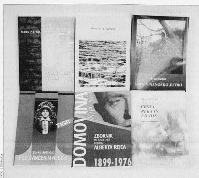
Nada Pertot, POMAGAJMO SI SAMI - 3,40 € Milan Lipovec, CESTA REKA IN LJUDJE - 3,40 € Ivan Rudolf, SPEV V NANOŠKO JUTRO - 3,40 € Pietro Brignoli, MAŠA ZA MOJE USTRELJENE - 3,90 € Zorko Jelinčič, POD SVINČENIM NEBOM - 3,90 € Albert Rejec - DOMOVINA, KJE SI - 4,30 €