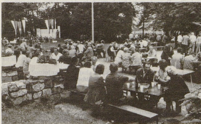
Srečanje upokojevcev Železarne