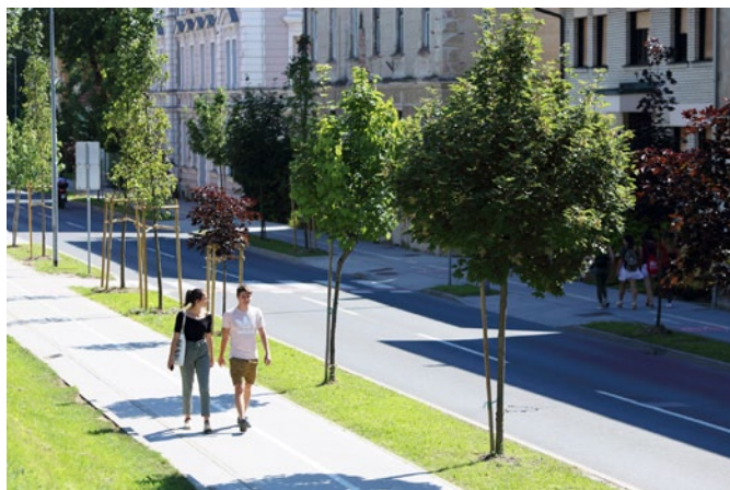
Nova drevesa rastejo v mestnem parku in tudi v drevoredu na Potrčevi.

Zavedamo se, da je kakovost bivanja vedno večji izziv, ki ga vključujemo že pri načrtovanju, in se bo z realizacijo le-teh bistveno povečala.