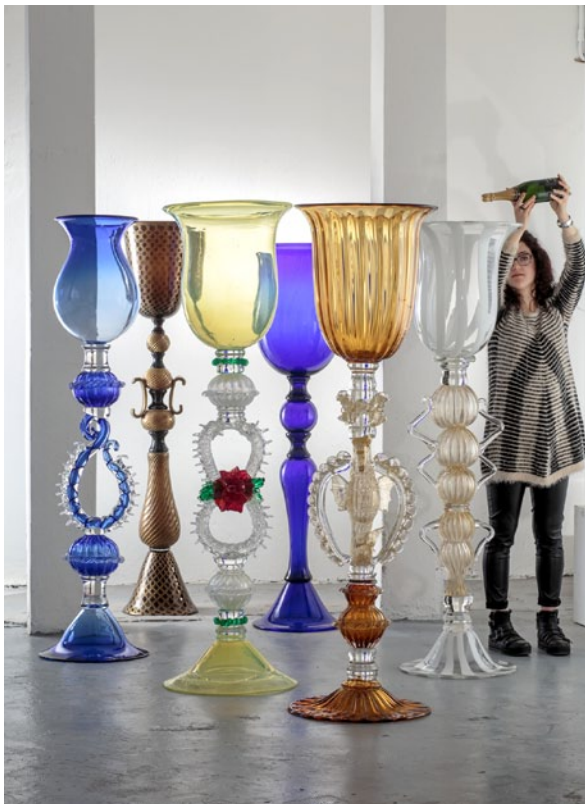
Vik Muniz: Individuals, 2017