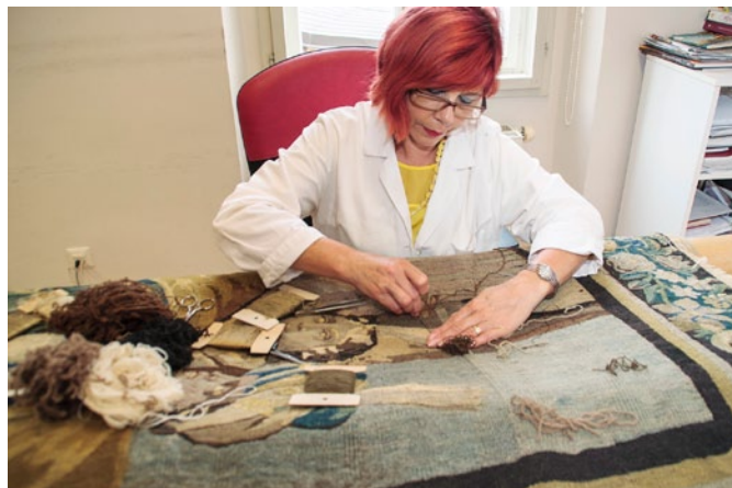
Zaključna dela na tapiseriji, veliki 2,8 x 1,6 m, ki so jo obnavljali tri leta.

V delavnici za keramiko in steklo v enoti Ormož skrbijo za obsežno arheološko keramično in stekleno gradivo.