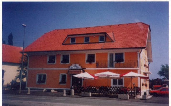
Bar Siva čaplja, Trnovska vas 44

Domoznanski oddelek 35 TRNOVSKI ZVON 2002