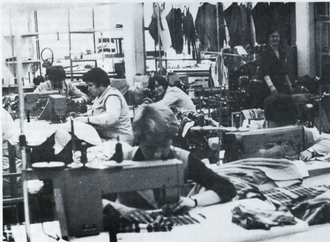
Le kratek pogled proti fotoaparatu, pa hitro z delom naprej. Posnetek je iz TOZD LOČNA.

Izvršilni odbor je med drugim obravnaval osnutek družbenega dogovora o skupnih osnovah za oblikovanje in delitev sredstev za OD in skupno porabo in osnutek družbenega dogovora o povračilu stroškov. Iz gospodarskega vestnika