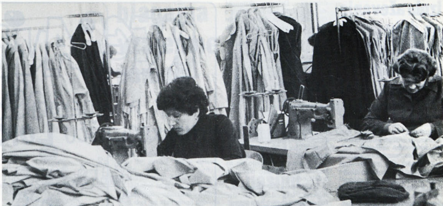
V TOZD TIP-TOP nastajajo tudi izdelki za naše ga poslovnega sodelavca „S model“ iz Z Nemčije.