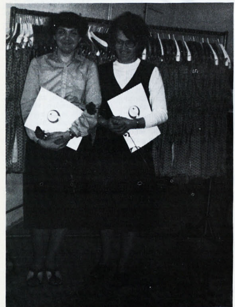
Če je kvaliteta dobra, sta kontrolorki v TOZD ZALA nasmejani, sicer pa zna biti tudi drugače...

Na občnem zboru so člani potrdili petnajst delegatov za skupščino, blagajnika in nadzorni odbor. Društvo je dobilo tudi svojega gospodarja in pa izvršilne organe za posamezne panoge.