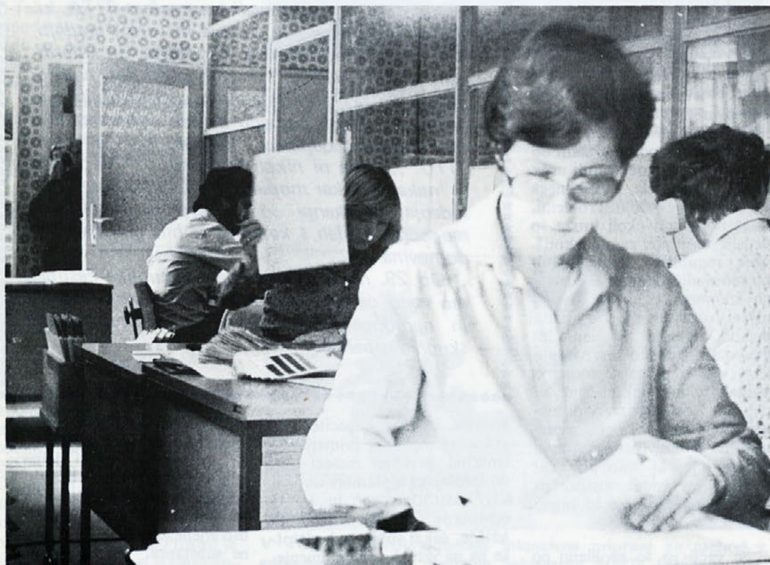
V prodaji je vedno živahno, ob „špicah“ kot so zaključevanja, pa je tempo še toliko hujši.