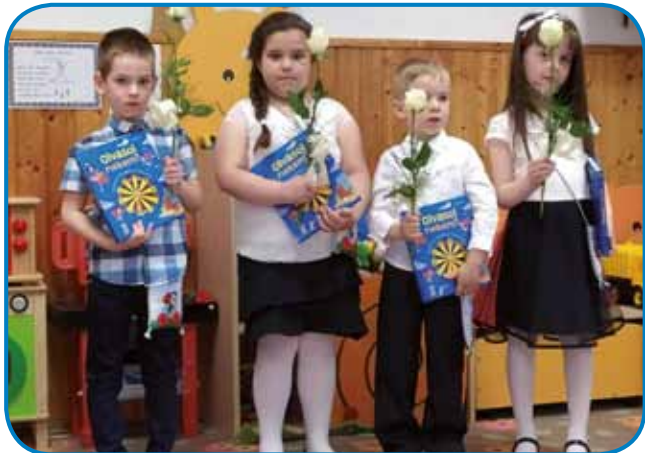
Naši štirje bodoči šolarji iz Vrtca Števanovci

ostalim bodočim šolarjem pa predvsem želimo pogumen korak v šolo, kakor tudi veliko