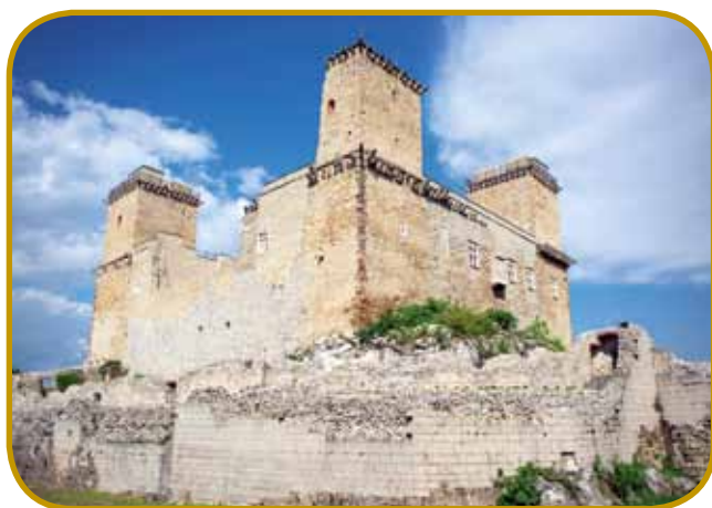
V Diósgyóri so Madžari že te zozidali grad z zemlé, gda so med Karpaté prišli - v cajti Lajoša Veukoga je grato najlepša zidina v rosagi

viteške igre, najbaukše pa je, če nas znautra kaulipela »domanjo lüstvo« v indašnji gvantaj. Edna spominska tabla kaže na tau, ka je blüzi grada živejla edna najvejša vogrška igralca v 19. stoleciji Róza Széppataki Déry . Eden serpentín pela v Lillafüred , kama - med vi-