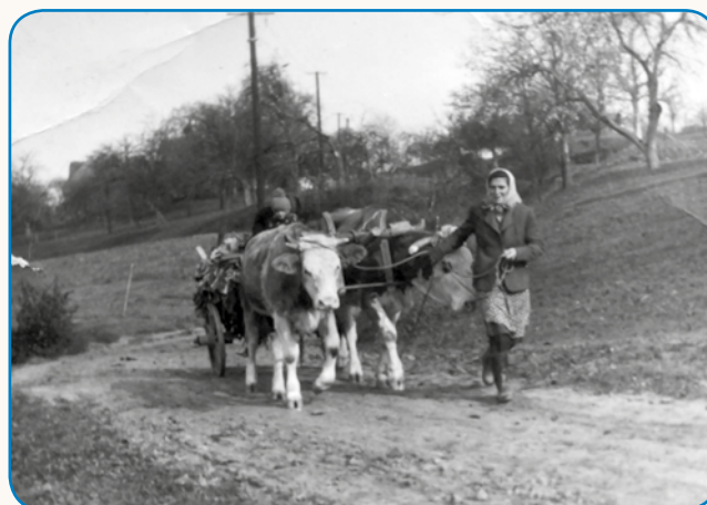
Štrikaš, steri je z meuv vret raso stran 8