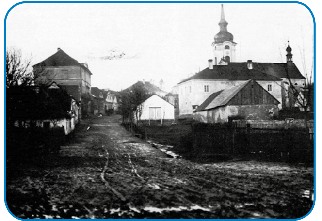
B. Bartók je želja, da bi spoznal »pravi« duh domovine, ljudi in (ljudske) glasbe, leta 1904 vodila pot na številna potovanja po vsej podeželski Madžarski

njegov klavirski ciklus 21 plesov za klavir (solo), od katerih so 1., 3. in 10. inštrumentirani za (simfonični) orkester. Ples št. 5 v fis-molu je najbolj značilen in popularen. Sicer pa