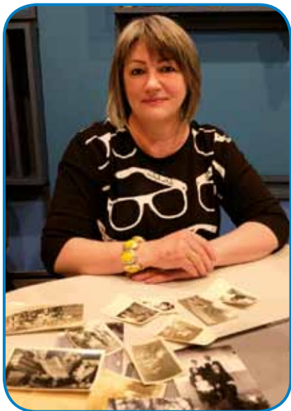
Ančika je po mamini smrti iz rojstnoga rama odnesla škatlo stari kejpov

- Je eden stari papir, na sterom piše ime tvoje stare ma-