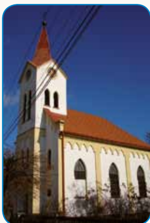
Obnavlja se sakalauvska cerkev stran 3