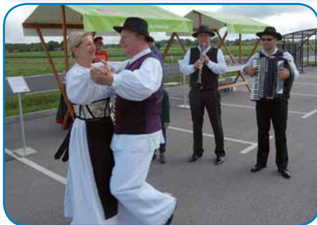
Z ljudsko glasbo in plesi so se predstavili člani KUD Beltinci

murskih ponudnikov. Na etnološki sejmski prireditvi so s prodajo na stojnicah sodelovali ponudniki iz Prekmurja in Prlekije. Predstavili so tudi, kako se izdeluje izdelke iz koruznega ličja. Vsi sodelujoči ponudniki so bili veseli, da po več kot pol leta spet lahko svoje izdelke ponujajo na sejmskih prireditvah. Na voljo pa so bile tudi različne sorte paradiznikov, ki so jih pridelali v rastlinjaku podjetja Paradajz. Sodelovali so tudi člani Kulturno-umetniškega društva Beltinci, glasbenika in plesalca v prekmurskih folklornih kostumih, ki so nastopili s prekmursko ljudsko glasbo in plesi. Organizatorji etnološkega dogodka so bili podjetje Paradajz iz Renkovcev, občina Turnišče in Zadruga za razvoj podeželja Pomelaj iz Male Polane. Projekt Luštna tržnica sofinancira Evropski kmetijski sklad za razvoj podeželja, prvo pa so organizirali v začetku julija lani.