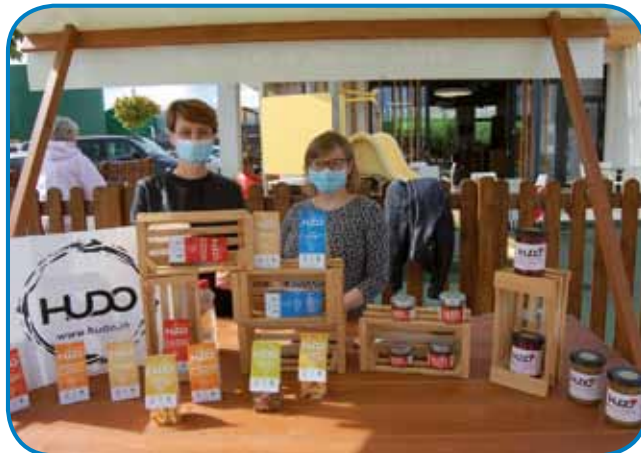
Sodelovali so ponudniki različnih izdelkov iz Prekmurja in Prlekije

Na Luštni domačiji v Renkovcih so organizirali 5. Lušno tržnico s predstavitvijo in ponudbo izdelkov domače in umetnostne obrti, z domačo kulinariko in napitki ter drugimi izdelki po-