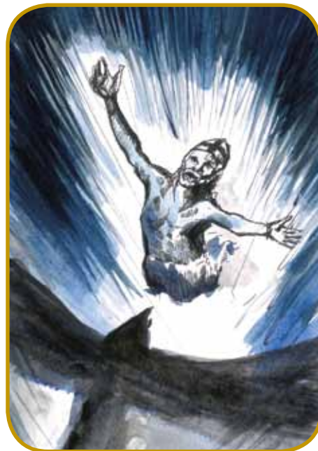
Engliška tradicija pripovejda, ka je püšpeka Medarda gnauk eden veuki ftič obrano od deži – eške gnes je njegvo imé povezano z mokrim vrejmenom