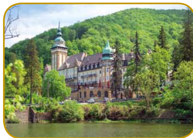
Neorenesančna palača v Lillafüredi je gnes luksuzni hotel - z njevgoga törma vidimo cejlo dolino med trejmi bregami

V Miskolci so leta 1823 prejkdali zidino gledališča, v šteroj so na Vogrskom oprvim v madžarskoj rejči špilali. Gnesnedén se té teater - vküper z ulicami, trgi in cerkvami - vsikšoga juniuša napuni z lidami, tistoga ipa držijo desetdnevni operni festival. Malo kisnej, septembra pa majo šegau organizérati takzvani »Cinefest«, šteri je najvejši madžarski filmski festival. Tisti, šteri pridejo na té programe, se najraj dojdjeméjo pred napisom »Hello Miskolc« nej daleč od županjske in varaške iže.