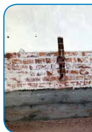
En tau sténé - hidroizolacijo more dobiti od znautra pa zvüna, ka bi se več nej vlašila

lacijov začniti, ka aj stené süje baudejo. Drügo de se po tistom delalo, tačas nema smisla, ka bi stoj farbo pa vōpopravlo. Vse leko pá vlažno grata, pa za par lejt de vse tak, kak smo začnili.«