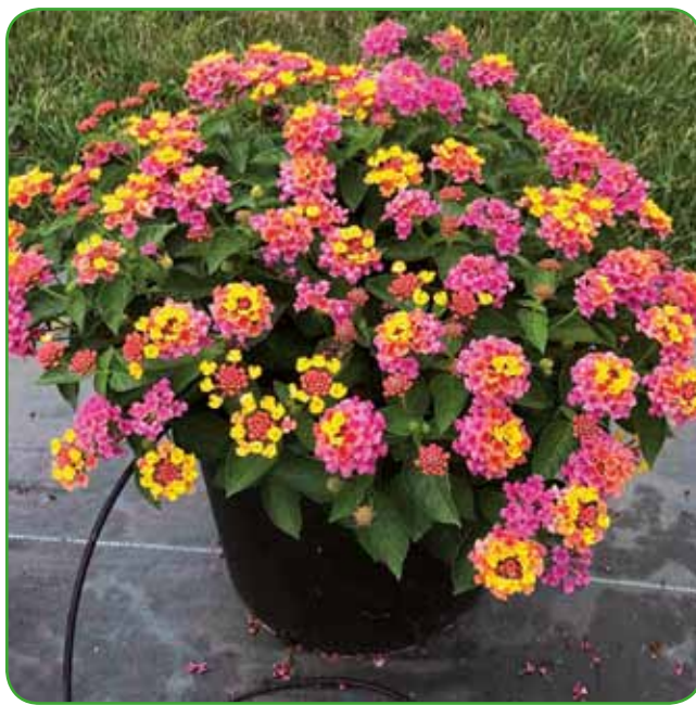
Lantana ali spreminjevalka privablja številne metulje

Gredice, terase, balkonska korita in grobovi kar vabijo za zasaditev z enoletnicami. Sadimo jih takrat, ko ni več bojazni za nizke temperature. Večina teh rastlin ljubi močno sonce in okrasno vrednost pokažejo prav v močnem žgočem soncu. Zato v sušnih razmerah potrebujejo več oskrbe, še posebej pomembno je redno zalivanje. Tako je zelo važno, da izberemo med ponudbo take, ki stresne situacije lažje prenašajo. Ob saditvi množičnega urejanja korit in gredic še niso najbolj privlačnega videza, zato jih radi spregledamo. Šele vrtnar ali poznavalec rastlin nas prepriča, da gre za res čudovite rastline.