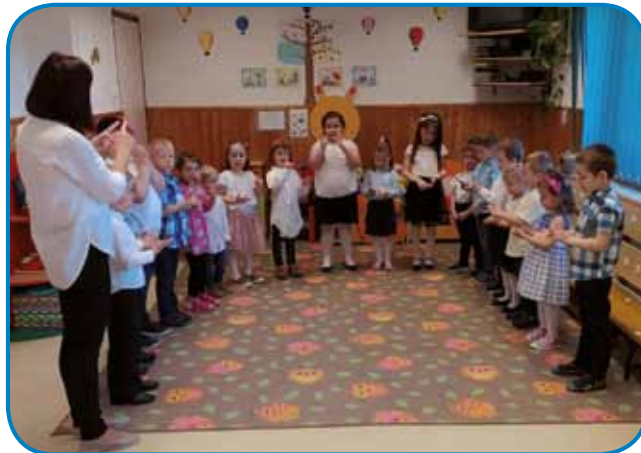
Vsi skupaj smo se predstavili s pesmicami in deklamacijami -Vrtec Števanovci

pa ne bom pozabil nikoli...« Tako so deklamirali pesmico štirje najstarejši otroci v Vrtcu