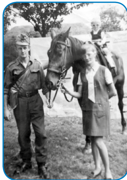
S sestro Agico pa bodaučim šaugorom Gyulo, steri je biu sodak na Seniki

- Vsepovsedik, gde si dolavzeta, gda si še mala bila, šaupo maš, te je tau moda bila?