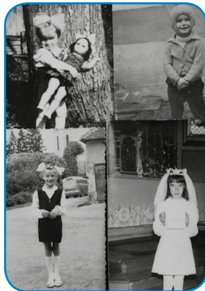
Gda je mala bila, je največkrat šaupo mejla v vlasaj

»Istina, ka lejpi mandli majo nasaba, depa ne mislim, ka bi k meši šle, zato ka na nogaj šebare majo. Nikan gvüšno ka so se