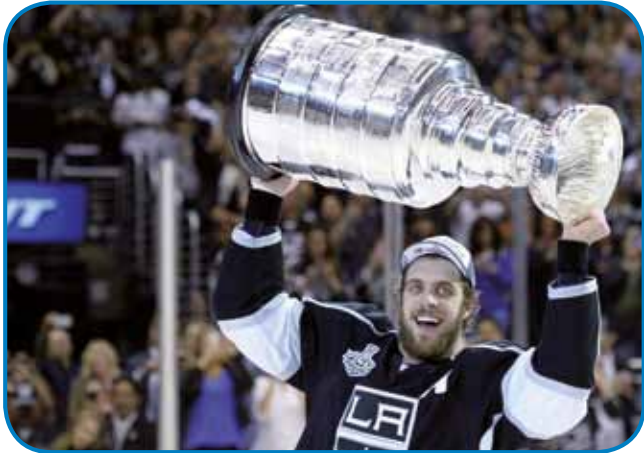
Zmagovalec lige NHL

veniji so vnoči večkrat gorstanili in so si poglednoli kakšno tekmo. V varaši angelov so Kopitar in njegovi krali že po dvej lejtaj ponovili svoj uspeh in so pa visiko v luft zdignili Stanleyev pokal, steroga