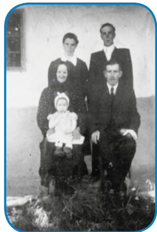
Kejpa starišov, stari starišov pa žlate