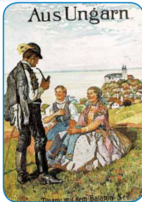
Tisto, kar je B. Bartók odkril o deželi, ljudeh in glasbi, pa se je zelo razlikovalo od romantičnih vtisov o Madžarski; tokrat je bil Bartók na Blatnem jezeru

Tu je opus nemškega romantičnega Johannes Brahmsa (1833-1897; Madžarski plesi , 1873; rapsodije ; 8 ciganskih pesmi ; ljudske pesmi idr.). V 20. stol. je med drugimi po vzoru F. Liszta, a v popolnoma novem slogu, zložil dve rapsodiji Madžar Béla Bartók (1881-1945). Znane rapsodije s folklornimi elementi so še Slovenske rapsodije Čeha An-