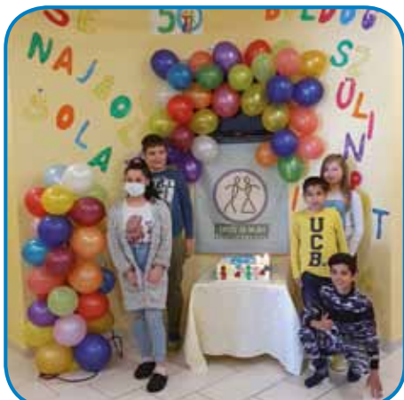
Obletnico so učenci in učitelji obeležili tudi s svojo ustvarjalnostjo v prostorih šole

Dvojezična osnovna šola II Lendava za otroke s posebnimi potrebami je obeležila petdeset let samostojne šole s slovesnostjo, ki so jo pripravili za šolarje na šoli in s spletno prireditvijo v gledališki in koncertni dvorani. Na praznovanju