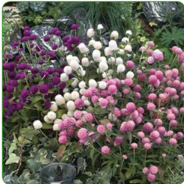
Gomfrena je enoletnica za zasaditev gredic in za izdelavo bidermajer šopkov in aranžmajev