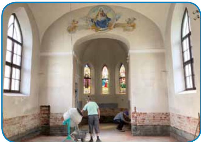
V sakalauvskej kapejli má mesto kauli stau lüdi - zdaj je prazna, njene stene so gaule

so vlažni bili pa je vse plesnivo grtivalo. Če se začne edna cerkev obnavlati, te trbej z izo-