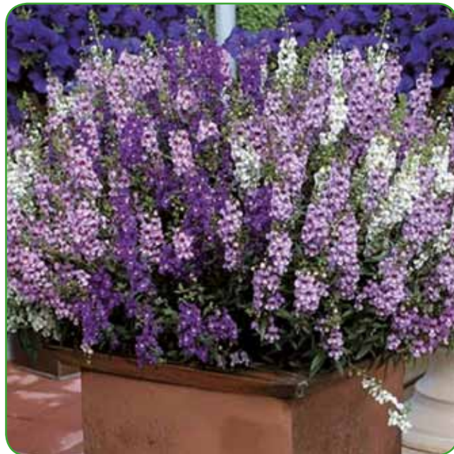
Angelonija ali poletna orhideja je primerna tudi za zasaditev velikih posod

enem letu. Zaradi bogatega cvetenja so praktična dopolnitev trajnic, skalnjakov in cvetličnih posod. Rastejo hitreje od drugih rastlin in hitro zapolnijo prazne prostore v zasaditvi. So idealna rešitev, da onemogočimo rast plevela, hkrati pa preprečimo izhlapevanje vode iz zemlje.