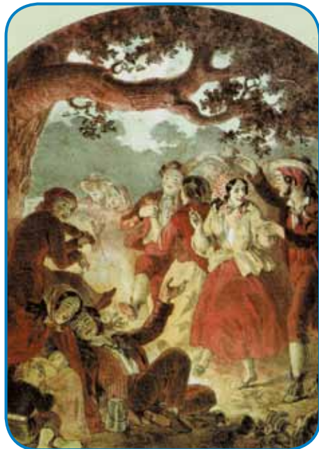
Skladatelj, kot sta bila F. Liszt in J. Brahms, je pritegnila energičnost in vznemirljivost »ciganske« plesne glasbe in kar je neposredno vodilo k (madžarski) rapsodiji

Madžarsko in njeno krajino, torej tudi Panonsko kotlino-nižino, v glasbenem pogledu