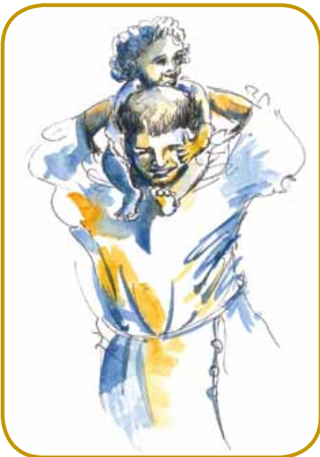
Svetoga Antona Padovanskoga v slovenski in vogrski cerkvaj vidimo z Božim Detetom v rokaj – po cejlom svejti se ma priporačajo v vsefelé stiskaj živeli.

Na Slovenskom radi gučijo: »Kakšo vrejmen Medarda vkane, takšo štirideset dni ostane.« Na Vogrskom ranč tak vörjejo, ka če za Medarda dež dé, te de štirideset dni tak ostalo tó. Sveti Medard